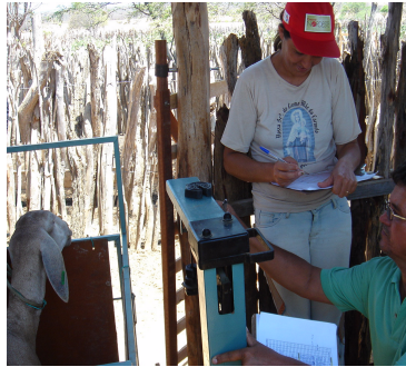
FIGURA 2. Monitoramento do peso corporal dos animais

09 a 12 de Novembro de 2009 - Curitiba - Paraná - Brasil