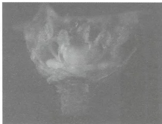
Figura 4 – Flor hermafrodita com estames cujo comprimento ultrapassa o comprimento do ovário, ficando à altura dos estigmas (Tipo 3).