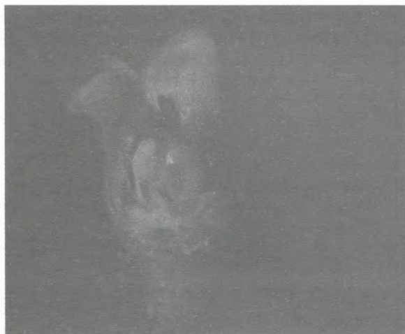
Figura 3 – Flor hermafrodita com estames desenvolvidos (Tipo 2).