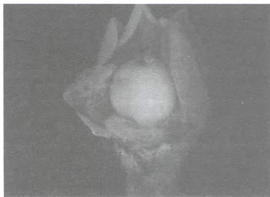
Figura 2 – Flor hermafrodita com estames vestigiais ( Tipo 1).