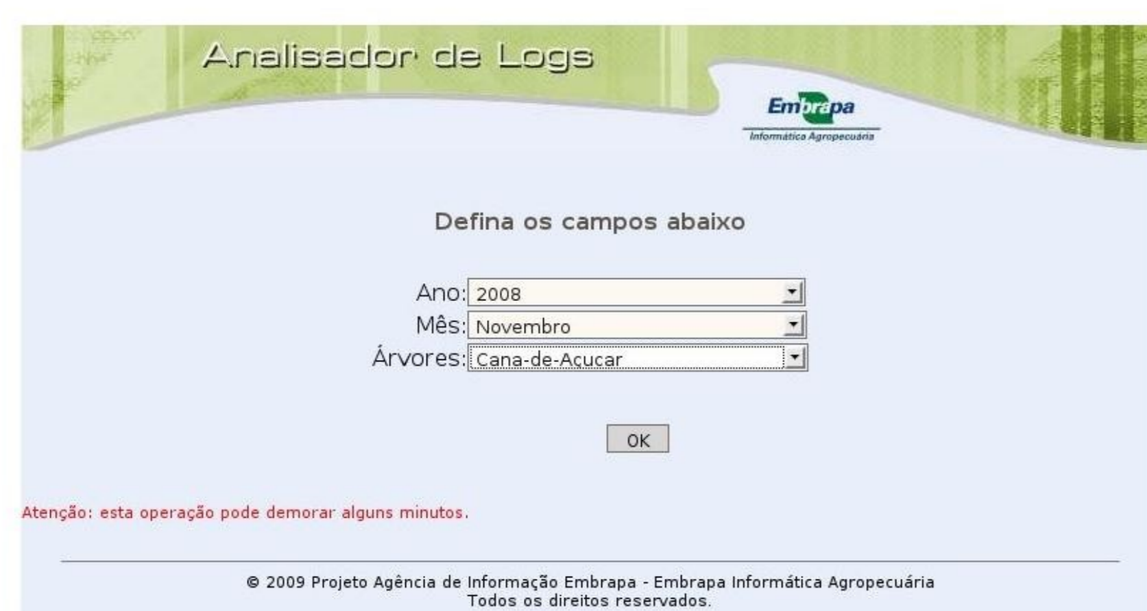
Tela Inicial do software GeraLog

Juntamente as linguagens citadas, foi integrado um módulo em Java que, dado um arquivo de log e uma Árvore de Conhecimento, separa todas as linhas deste log onde ocorrem referências a Árvore em questão.