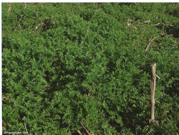
Fig. 52. Serradela.

É leguminosa anual de inverno. Possui caule prostrado e pubescente, atingindo até um metro de comprimento. As folhas superiores são sésseis, com 6 a 15 pares de folíolos, oblongo-lanceoladas e estipuladas (DERPSCH & CALEGARI, 1992). As flores são em número de 3 a 5, sobre pedúnculos axilares mais compridos que as folhas, de coloração róseo-pálida, com estandarte de cor violeta ou cor-de-rosa (Fig. 52). Os legumes são geralmente encurvados, glabros, contendo de 2 a 3 sementes. A serradela de flores amarelas apresenta legumes com até 6 sementes.