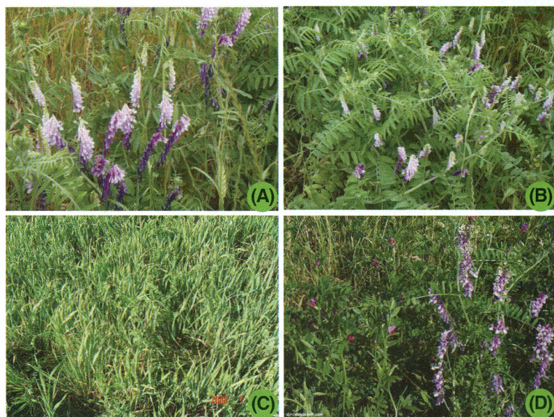
Fig. 51. (A-B) Plantas de ervilhaca no florescimento, (C) Consorciação de aveia preta e ervilhaca, (D) Ervilhaca comum (esquerda) e peluda (direita).

vel, decumbente e trepador, que atinge até 0,90 m de comprimento (CALEGARI et al., 1993). A planta atinge em média 0,35 m de altura. As folhas são alternadas, compostas, com numerosos folíolos e gavinha terminal (Fig 6). As flores são geralmente pareadas nas axilas das folhas, em forma de racemo, com número variável, subsésseis, com 1,8 a 3,0 cm de comprimento, cor violeta-purpúrea ou, raramente, brancas (Fig. 6 e 51). Os legumes são quase cilíndricos, compridos, com 2,5 a 7,0 cm de comprimento e 5 a 8 mm de largura, de cor marrom, com 4 a 12 sementes. As sementes são globosas ou, até certo ponto, compridas, com 3 a 5 cm de diâmetro, lisas, cor verde-acinzentada para marrom ou preta, raramente amarelada.