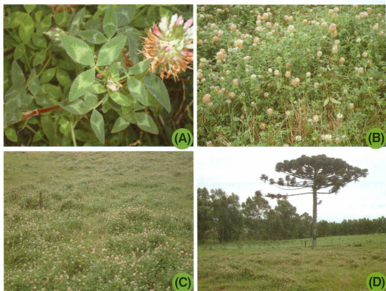
Fig. 53. (A) Folhas e inflorescência de trevo vesiculoso Yuchi, (B, C e D) Pastagem consorciada de aveia preta-azevém-trevo Yuchi em Passo Fundo, RS.

centração de taninos), apresentando o dobro do tamanho da semente de trevo branco e, 70%, delas possuem o tegumento duro, impermeável, necessitando de escarificação para iniciar o processo de germinação.