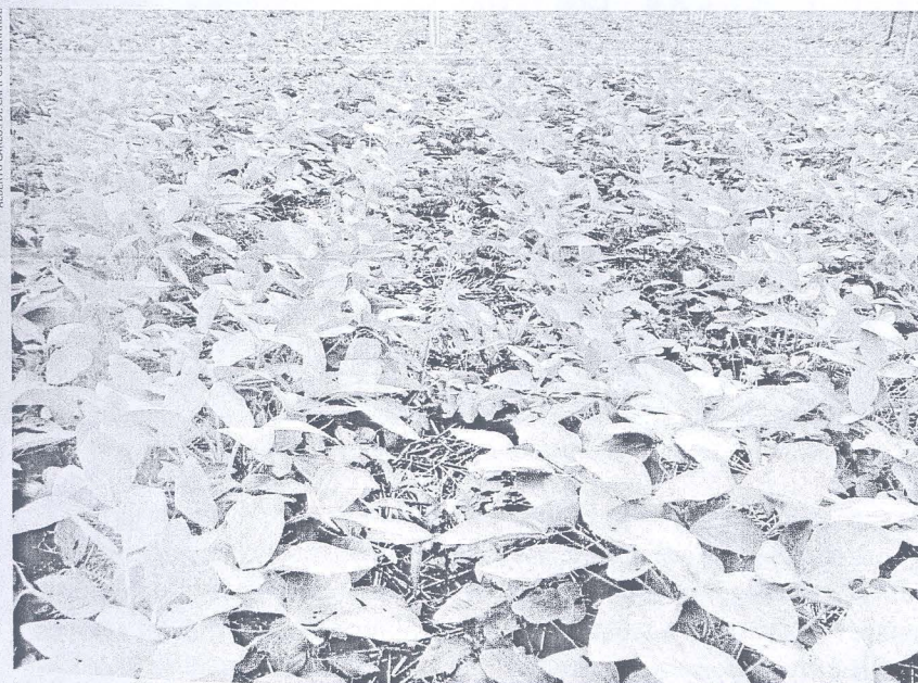
FIGURA 2 | SOJA EM SPD ORGÂNICO, SOBRE PALHADA DE AVEIA*

* Londrina, PR, safra 2007/2008, 35 dias após a semeadura. Observa-se que a cobertura da palhada, com 6 t/ha de matéria seca, reduziu a infestação de invasoras ao ponto de não haver interferência sobre a cultura, até a data da foto. Contudo, as invasoras em desenvolvimento na área exigem controle para evitar perdas quantitativas e qualitativas na produção final. Numa área como esta, uma única operação de controle manual pode ser suficiente. Para não revolver a palha nessa operação, são melhores as enxadas de lâmina chata, utilizadas na olericultura