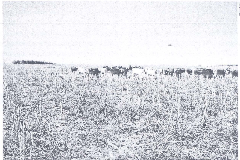
FIGURA 1 | GADO EM PASTO DE B. BRIZANTHA CV MARANDU, APÓS CULTIVO DE MILHO

O Silp tem despertado atenção pelas vantagens que apresenta em relação aos sistemas de monocultivo e, principalmente, de pecuária extensiva, especialmente porque possibilita que a terra seja explorada durante todo o