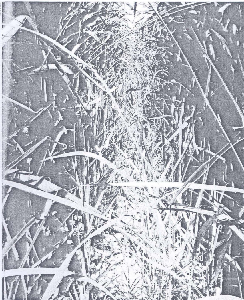
Plantio de B. brizantha cv Piatã , na entrelinha do sorgo