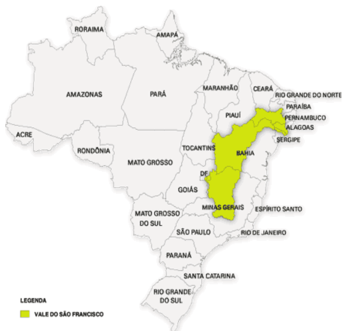
Figura 1 - Mapa do Brasil mostrando o Vale do rio São Francisco.

O “velho Chico” como é tratado carinhosamente ou “Rio da integração nacional” corta cinco estados: Minas Gerais, onde nasce na Serra da Canastra, Bahia, Pernambuco, Sergipe e Alagoas, onde desemboca no Oceano Atlântico numa extensão de 2.863 km. Classificado como Alto São Francisco, Médio São Francisco, Submédio São Francisco e Baixo São Francisco, o Vale do São Francisco ocupa uma área de 636.920 km 2 (Figura 1).