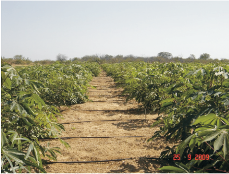
Figura 1. Banco Ativo de Germoplasma de Mandioca do Semiárido brasileiro, Petrolina, PE.

Atualmente, tem sido dada prioridade para a caracterização agrônômica das plantas, visando a seleção dos acessos promissores para o uso como alimentação humana, animal (forragem) e processamento. Nestas caracterizações são avaliadas o peso de parte aérea, da raiz, o tempo de cozimento, precocidade, teor de amido nas raízes e fatores anti-nutricionais, como presença de HCN. Com as caracterizações podem-se conduzir pesquisas de campo, com melhoramento, convencional ou participativo. Nesse sentido, algumas variedades tem se destacado em produtividade em áreas dependentes de chuva como a Engana Ladrão (TSA 1) e Brasília (TSA 128) (SILVA, A. et al., 2009). Estas variedades encontram-se bem disseminadas na região, sendo a Engana Ladrão possuidora de alto teor de HCN (brava) e a Brasília com baixo HCN (mansa). As duas têm sido consideradas importantes, tanto do ponto de vista de material forrageiro, como para consumo humano (Brasília) nas áreas dependentes de chuva.