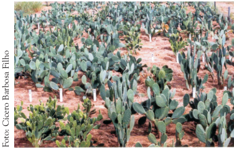
Figura 2. Visão geral do Banco de com acessos procedentes de vários países e do programa de melhoramento genético do IPA.

gigante (Tabela 3). Outros resultados importantes referem-se à maior altura e menor diâmetro transversal das variedades 1278 e 1311 (Tabela 3), consideradas características muito apropriadas para os sistemas de cultivo da região, quais sejam, maior crescimento vertical, e menor diâmetro transversal, parâmetros ideais para consórcio com culturas anuais, e na mecanização das operações de capinas e de distribuição de esterco e no transporte da palma para o cocho. Sistema de consórcio já havia sido estudado anteriormente por Albuquerque e Rao (1997).