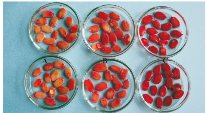
FIGURA 2. Sementes de leucena submetidas ao corte lateral e posterior remoção do tegumento, após duas (acima) e quatro (abaixo) horas de coloração em soluções de tetrazólio a 0,075% (A), 0,15% (B) e 1% (C).