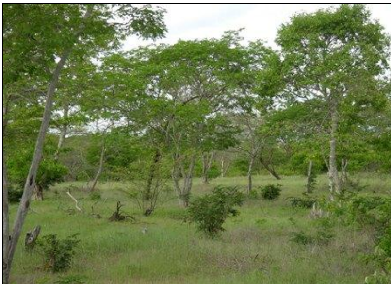
Figura 4 - Caatinga raleada em Sobral, CE.

herbáceo, propiciando a formação de uma pastagem nativa de elevada produtividade (Figura 4).