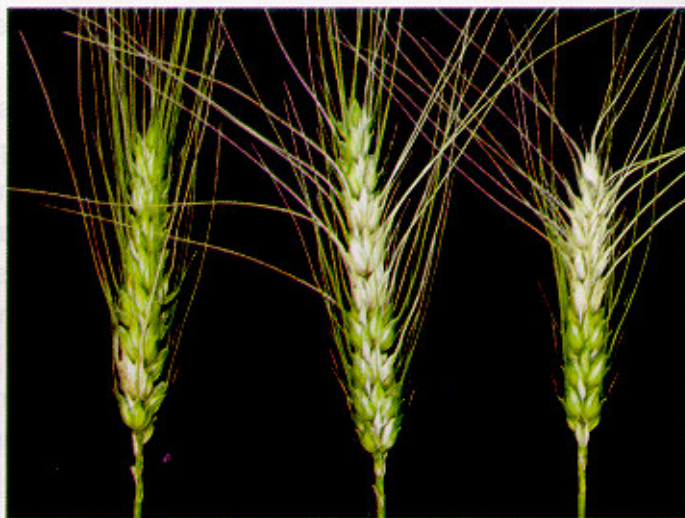
Fig. 1. Espigas de trigo com sintomas de giberela.