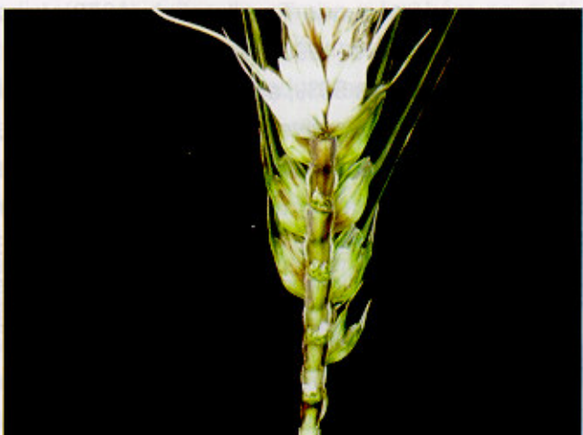
Fig. 8. Ráquis de espiga de trigo com sintomas de giberela semelhantes ao de brusone.