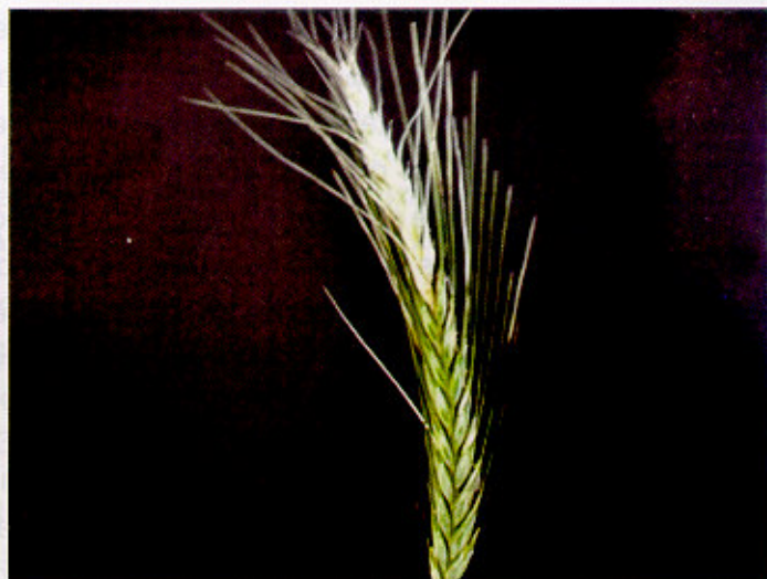
Fig. 11. Espiga de tritcale com sintomas de brusone.