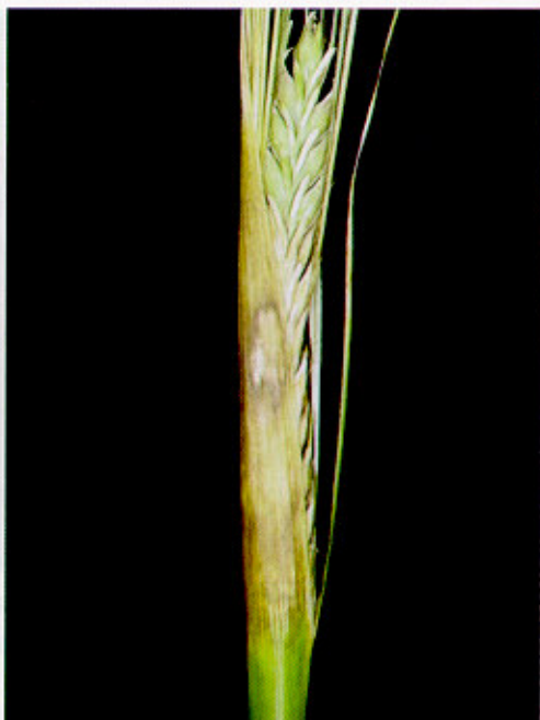
Fig. 4. Espiga e bainha de cevada com sintomas de giberela.