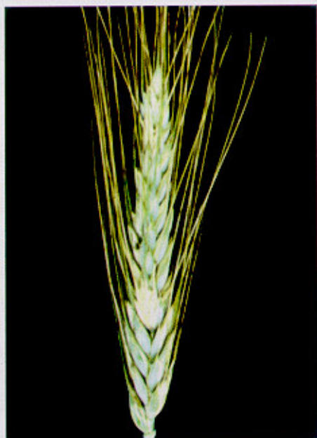
Fig. 6. Espiga de triticale com sintomas de giberela.

Nos três cereais (cevada, trigo e triticale), às vezes, os sintomas de giberela podem ser confundidos com os de brusone (Fig.7). Nesse caso, o ráquis da espiga afetada por giberela apresenta coloração escura na região de espiguetas sadias (Fig. 8) e os grãos oriundos da parte afetada da espiga mostram os sintomas típicos de giberela (LIMA, 2004).