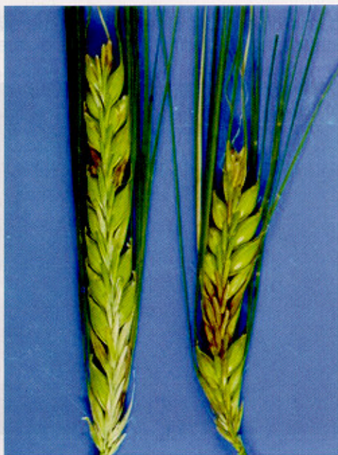
Fig. 3. Espigas de cevada com sintomas de giberela.

Os sintomas característicos de giberela em cevada são semelhantes aos observados em espigas de trigo, em relação à descoloração de espiguetas, porém, raramente há desvio de sentido das aristas de espiguetas afetadas (Fig. 3). A infecção pode ocorrer à partir do início da exposição da espiga e geralmente ocorre em mais de um local na espiga, apresentando distribuição pontual, não sendo comum a evolução dos sintomas por toda a espiga, exceto, quando as espigas ficam parcialmente retidas e encobertas pela bainha da folha bandeira (Fig. 4). Os grãos provenientes das espiguetas afetadas são, frequentemente, mais finos em relação aos sadios, e podem mostrar, parcialmente, a cor rosa (Fig. 5) (LIMA, 2004).