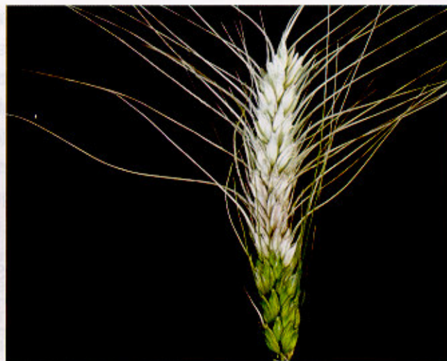
Fig. 7. Espiga de trigo com sintomas de giberela semelhantes aos de brusone.