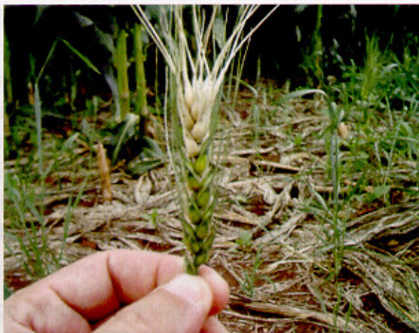
Fig. 9. Espiga de trigo com sintomas de brusone.