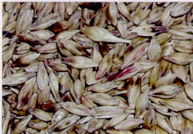
Fig. 5 Grãos de cevada com sintomas de giberela.