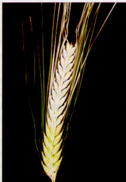
Fig. 10. Espiga de cevada com sintomas de brusone.