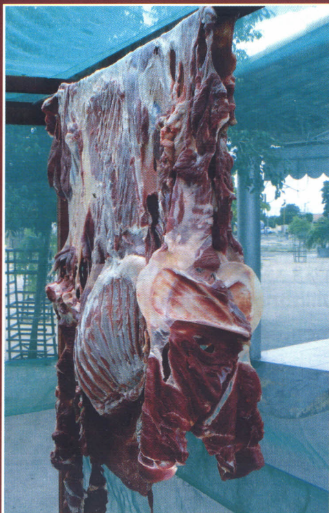
Manta ovina em processo de secagem