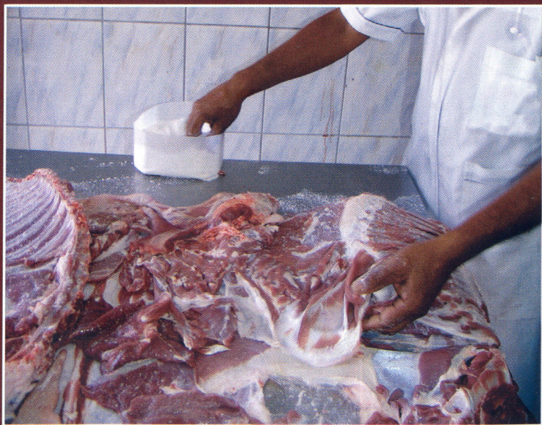
Manteiro executando a salga da manta

Após a manteação, a salga é realizada pela simples deposição de sal comum refinado (cloreto de sódio) em toda superfície (interna e externa) da manta. O manteiro usa as próprias mãos para depositar o sal, procurando distribuí-lo de maneira uniforme, numa quantidade que varia de 250 a 350