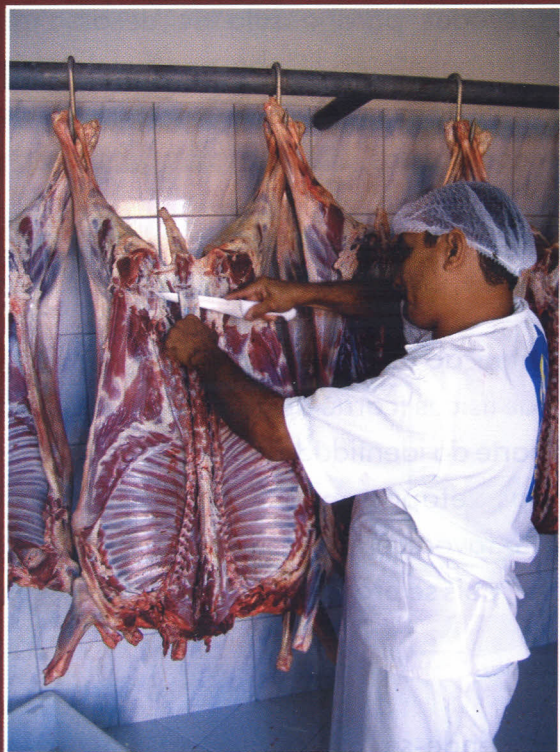
Retirada da coluna vertebral "espinhaço da carcaça"

A retirada da coluna vertebral inicia-se a partir de cortes no osso sacral, em ambos os lados, seguindo uma linha imaginária paralela à coluna. Logo após, faz-se os cortes das costelas, também em ambos os lados da carcaça, à altura da