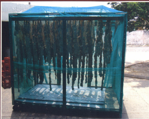
Cabine móvel para secagem das mantas