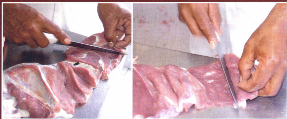
Manteação das porções musculares: paleta e perna

A manteação das porções musculares é feita observando-se a seguinte sequência: contrafilé; músculo do quarto traseiro; coxão duro; lagarto; alcatra; coxão mole e patinho; quarto dianteiro; paleta; acém e contra filé. Estas peças são adelgaçadas (cortadas promovendo a abertura dos músculos) em mantas de 1,0 a 2,5 centímetros de espessura, variando conforme o volume muscular. Permanecem na carcaça apenas os ossos das costelas e das paletas, para dar sustentação à manta na secagem pós-salga. A redução da espessura muscular pela manteação tem por objetivo acelerar a penetração do sal e a redução da umidade, bem como dar as características físicas que identificam o produto.