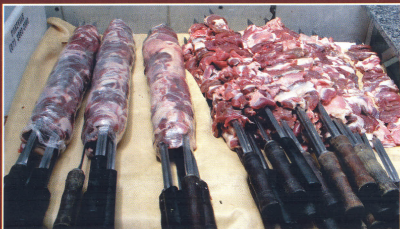
Espetos de manta ovina

Existem opções quanto à quantidade de gordura dos pedaços de carne espetados, que podem variar em função da exigência dos consumidores. Em geral são preparados espetos mistos, em que são colocados pedaços com quantidade de gordura variada. No preparo do espeto magro são utilizados os pedaços de carne com aparência menos gordurosa.