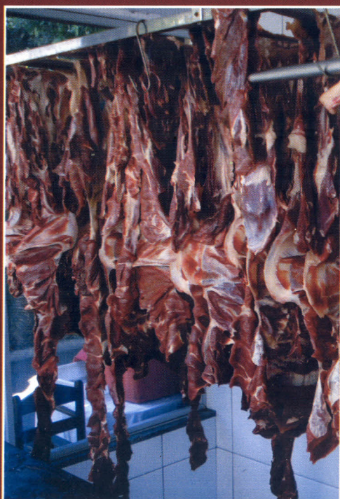
Mantas estendidas para secagem

Após a pesagem, as mantas salgadas são estendidas com a superfície interna voltada para fora em varais metálicos dentro das cabines de secagem. A secagem é realizada pela ação do vento e do sol, por um período de três a quatro horas. Este período varia em função da necessidade específica do