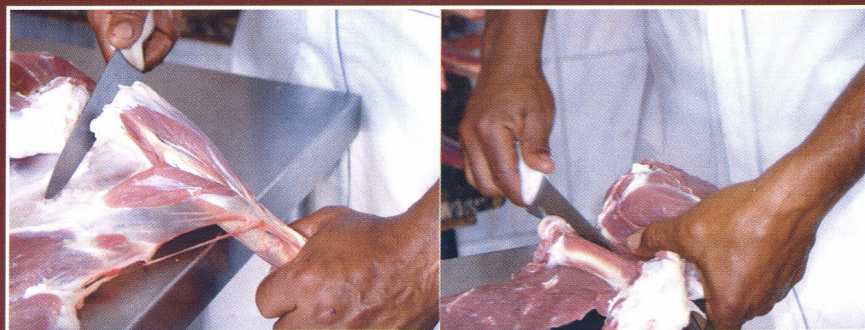
Dissecação e retirada dos membros anteriores e posteriores

Dando continuidade à desossa, se faz a separação dos costilhares (compostos por todas as costelas ligadas pelo osso esterno na parte ventral) em ambos os lados da carcaça, para facilitar a manteação. Coloca-se, então, a manta sobre uma mesa de aço inox e realiza-se a retirada dos linfonodos