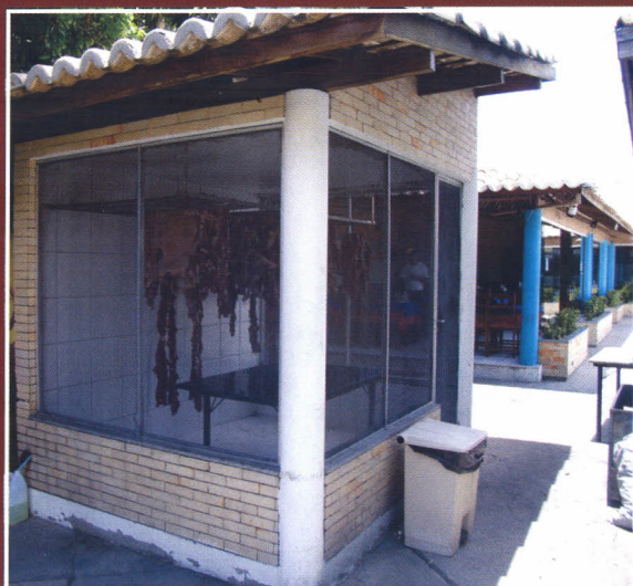
Cabine em alvenaria para secagem das mantas