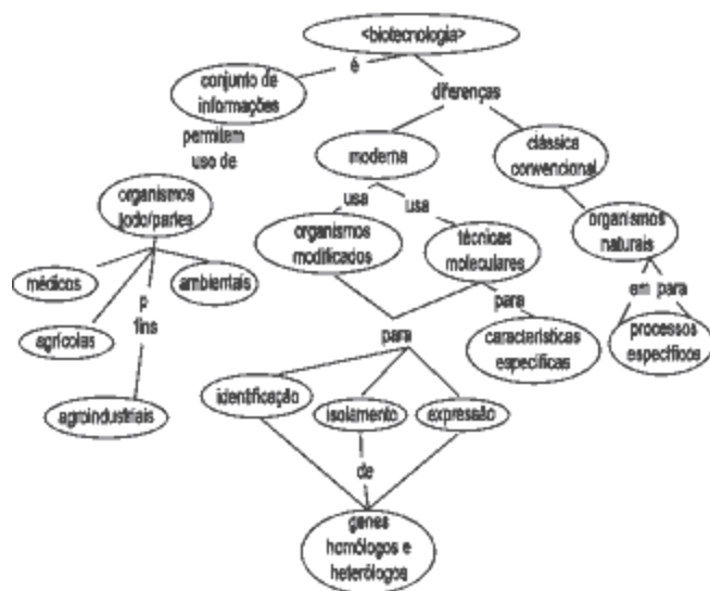
Fig. 1. Mapa conceitual com base nas definições da Embrapa

O mapa conceitual, graficamente concebido com o uso de elipse, para conter o conceito e de linhas que indicam as relações, Peña (1996), nos fornecem elementos para realizarmos, em conjunto com os especialistas, uma análise das definições contidas nos dois documentos.