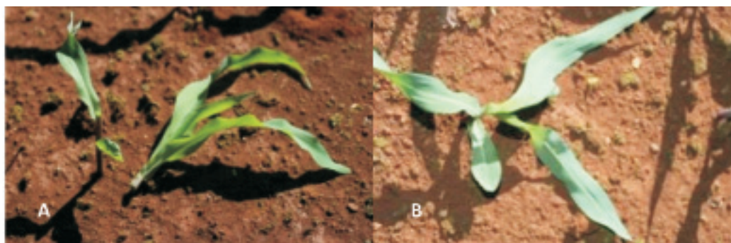
FIGURA 1. Aspecto de plantas de milho, aos 10 dias após a emergência, submetidas à simulação de danos mecânicos de folhas. Corte (A) e maceração (B). Sete Lagoas, MG, 2008.

de Dichelops melancthus (percevejo barriga-verde), no período V1 a V3, Roza-Gomes (2010) detectou a redução de 17,6% da biomassa aérea acumulada, com base nos valores obtidos da testemunha, ainda que entre os tratamentos não tenha sido configurada diferença estatística.