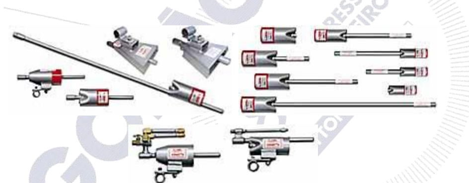
Figura 1. Tipos de queimadores usados para o controle de plantas daninhas.

SHOWLER, A; FUNK, P; ARMIJO, C; Effect of thermal defoliation on cotton leaf desiccation, senescence, post-harvest regrowth and lint quality. The Journal of cotton science , n. 10, p. 39-45. 2006.