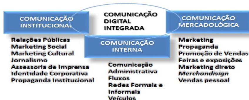
Figura 1 – Comunicação digital no âmbito do composto comunicacional empresaria

Na esteira desta racionalidade Corrêa (2009b) reforça a necessidade das empresas estabelecerem uma comunicação do tipo digital. A comunicação digital é entendida pela autora como aquela que usa as TIC e suas ferramentas digitais para facilitar e dinamizar as relações entre as pessoas que integram as empresas e entre estas e seus diversos públicos no contexto de um processo institucional integrado. A comunicação digital, como sinaliza a Figura 1, alinha a comunicação interna, mercadológica e institucional das empresas favorecendo a constituição de um composto comunicacional que fortalece não apenas as relações que elas mantêm com seus públicos, mas, principalmente, a construção de vantagens competitivas (KUNSCH, 2003).