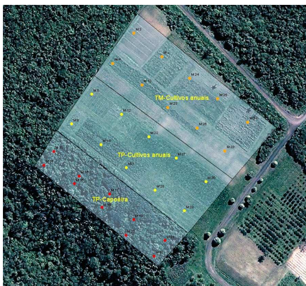
Figura 1. Localização dos pontos amostrais georeferenciados por sub-área: terra preta capoeira,

Os resultados obtidos foram submetidos à análise de variância com modelos mistos e o teste de separação de médias de Tukey-Kramer ( p < 0,05 ). Essa análise foi realizada utilizando o PROC MIXED do pacote estatístico SAS 9.1).