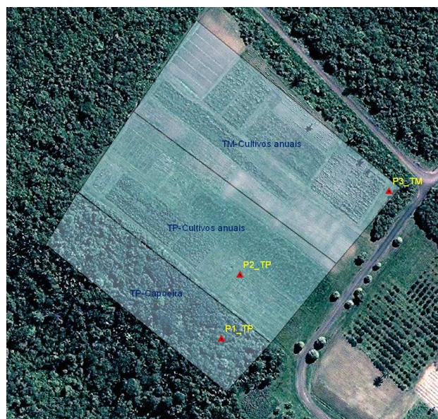
Figura 2. Localização dos perfis utilizados para a coleta da densidade do solo.

terra preta cultivos anuais e terra mulata cultivos anuais.