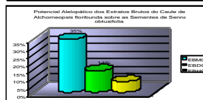
Tabela 2: Efeitos dos extratos brutos do caule de Alchorneopsis floribunda sobre a germinação de sementes de Senna obtusifolia (dados expressos em percentual de inibição em relação ao tratamento testemunho).