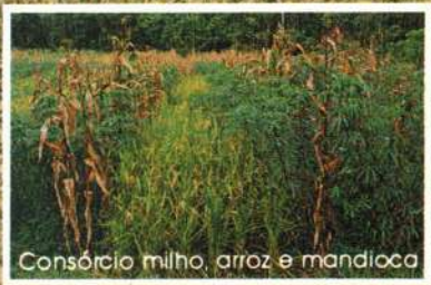
Consórcio milho, arroz e mandioca