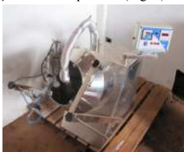
Fig. 1 - Drageadeira farmacêutica, com sistema de secagem por ar comprimido.

Serão utilizados quatro polímeros: soluções poliméricas baseadas nas proteínas zeína (4g/L) e quitosana (2g/L) e dois dos polímeros sintéticos industriais mais utilizados na indústria de sementes de espécies forrageiras tropicais (versões com corante e sem corante). A zeína (proteína do glúten do milho) será extraída conforme metodologia descrita por Assis e Leoni (2009). No caso da quitosana (fibra formada por aminopolissacarídeo derivado da quitina, polímero encontrado no exoesqueleto dos crustáceos), serão utilizados os derivados resultantes da alquilação de quitosana comercial com aldeídos e da quaternização de quitosana comercial com DMS (dimetilsulfato) (BRITTO e ASSIS, 2007). Ambas as soluções dos polímeros naturais serão preparadas conforme Assis e Leoni (2009). Em todos os casos, para o recobrimento das sementes, serão utilizados os métodos: 1) imersão das sementes nas soluções e secagem ao ar; 2) pulverização da solução em drageadeira farmacêutica, seguida de secagem por pulverização de ar comprimido (Fig. 1).