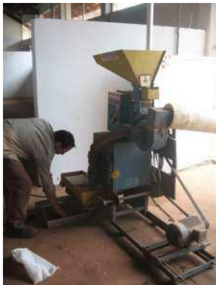
Fig. 3 - Máquina para beneficiar arroz

No caso de sementes de estilozantes Campo Grande, as mesmas serão submetidas à escarificação mecânica industrial, por meio de máquina para beneficiar arroz (Fig. 3), submetidas aos tratamentos com os referidos polímeros e analisadas quanto a germinação (BRASIL, 2009) imediatamente após os tratamentos e a cada 30 dias, até completar oito meses do tratamento.