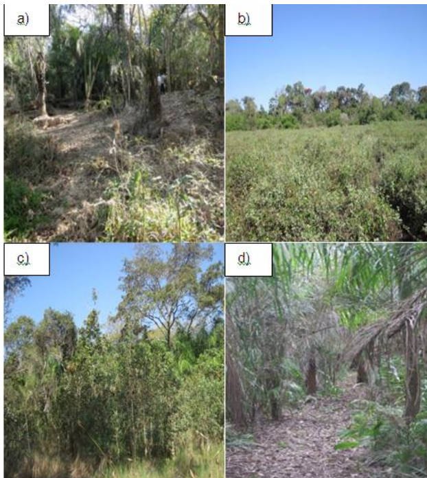
Figura 2. a) vegetação em P1 (vista de dentro do sub-bosque); b) vegetação em P2 (vista de fora); c) vegetação em P3 (vista de fora); d) vegetação em P3 (vista do sub-bosque).

A drenagem neste paleodique pode ser considerada como lenta em relação ao P3 e mais rápida em relação ao P1, evidenciando a maior presença de mosqueados na forma distinta. Com base na descrição morfológica, análise física e química, este solo foi classificado como PLANOSSOLO NÁTRICO Órtico dúrico (SiBCS, 2006); Albic Duric Solonetz (WRB, 2006) e Typic Natraqualf (Soil Taxonomy).