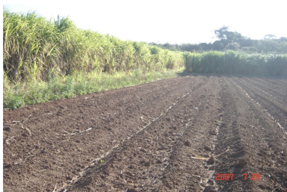
Figura 3 Quebra vento formado com duas fileiras de capim elefante em torno da área de cultivo, terreno preparado para o plantio das mudas.

Uma forma de resolver o problema dos ventos frios é a inserção de quebra vento no local de plantio, separar a área em áreas menores e fazer o plantio de espécies resistentes a vento. Na figura 3, observa-se o quebra vento formado de capim elefante, neste estudo foi eficiente para bloquear os ventos frios em cultivos de alface. O plástico preto suprimiu com maior eficiência o crescimento das plantas espontâneas nos canteiros, porém a diversidade genética no agroecossistema foi promovida pela presença de plantas espontâneas entre os canteiros.