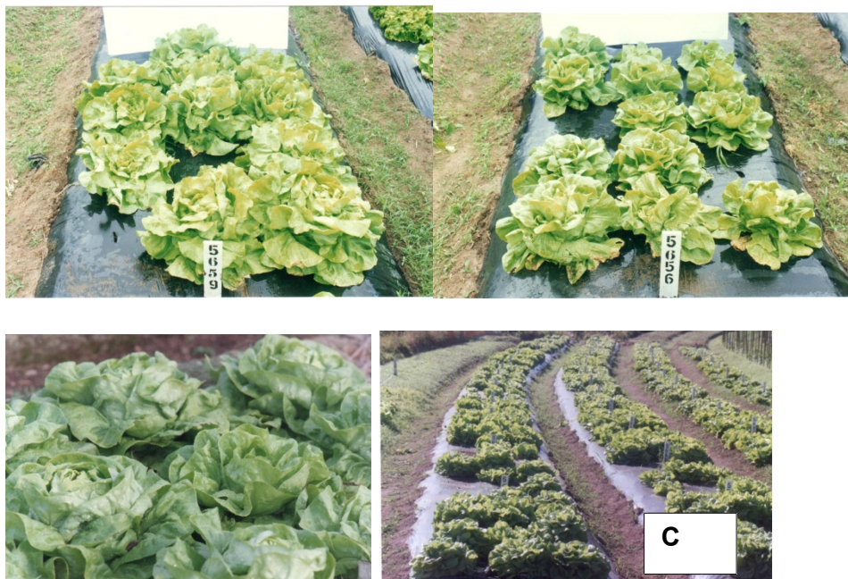
Figura 2 Danos causados por ventos frios em alface na Região de Pelotas (A) e Serra Gaucha (B) e vista parcial do experimento no RS (C).

Uma forma de resolver o problema dos ventos frios é a inserção de quebra vento no local de plantio, separar a área em áreas menores e fazer o plantio de espécies resistentes a vento. Na figura 3, observa-se o quebra vento formado de capim elefante, neste estudo foi eficiente para bloquear os ventos frios em cultivos de alface. O plástico preto suprimiu com maior eficiência o crescimento das plantas espontâneas nos canteiros, porém a diversidade genética no agroecossistema foi promovida pela presença de plantas espontâneas entre os canteiros.