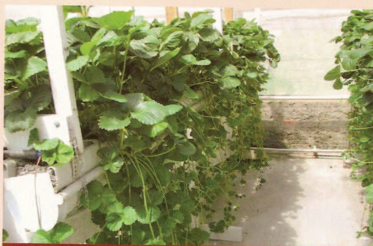
Plantas matrizes de morangueiro em pleno desenvolvimento dos estolões em sistema de produção fora de solo

Os Estados Unidos da América (EUA) e alguns países europeus têm adotado a produção fora de solo de mudas de morangueiro nos últimos anos, motivados principalmente pela necessidade de reduzir a contaminação ambiental e obtenção de produções precoces. No Brasil este sistema tem por objetivo atender os mesmos princípios, além de fortalecer a produção nacional de mudas, porém, são necessárias adaptações devido às condições climáticas. Uma destas está relacionada à falta de temperaturas baixas durante o período propagativo do morangueiro, pois nas condições climáticas brasileiras, são poucas as regiões que apresentam mais de 400 horas acumuladas de frio (Temperaturas <7^{\circ}\text{C} ) durante os meses de produção das mudas, condição predominante na região da Patagônia, onde são produzidas as mudas de morangueiro chilenas e argentinas. Este período de frio é