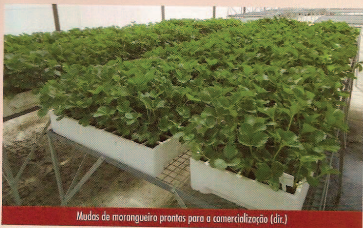
Mudas de morangueiro prontas para a comercialização (dir.)

sob nebulização, dando origem à muda propriamente dita. As mudas produzidas dessa forma são comercializadas e plantadas com as raízes envoltas pelo torrão de substrato, sendo denominadas de mudas plug plants ou tray plant , bem adaptadas aos cultivos semi-hidropônicos e convencionais.