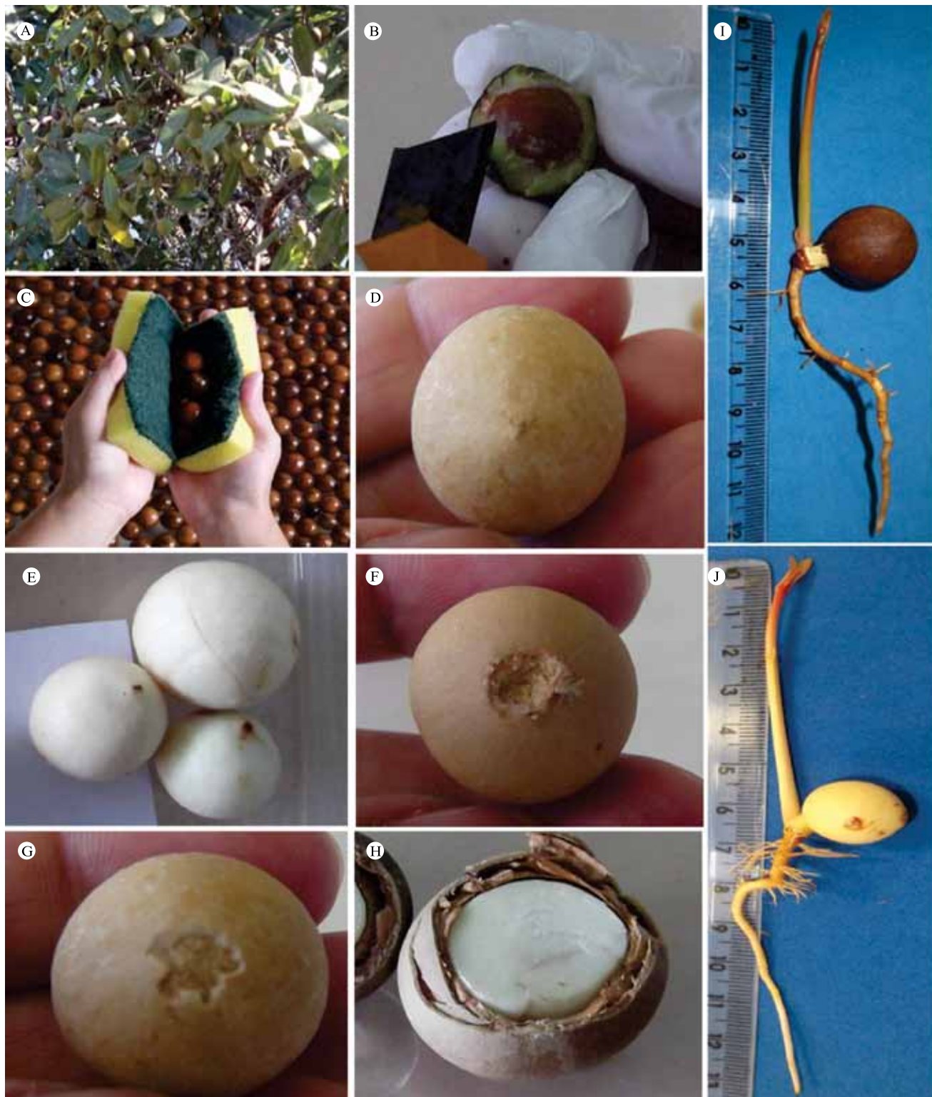
Figura 1. Ramos de guanandi ( Calophyllum brasiliense ) com frutos (A); remoção da polpa do fruto (B); lavagem das sementes (C); sementes íntegras (D); sementes nuas, sem endocarpo ou tegumento (E); sementes com punctura no endocarpo, na região próxima ao eixo embrionário (F); semente com punctura no endocarpo, na região oposta ao eixo embrionário (G); semente cortada a 1/3 da região oposta ao eixo embrionário (H); plântula normal, oriunda de sementes íntegras (I); e plântula normal, oriunda de sementes nuas (J).