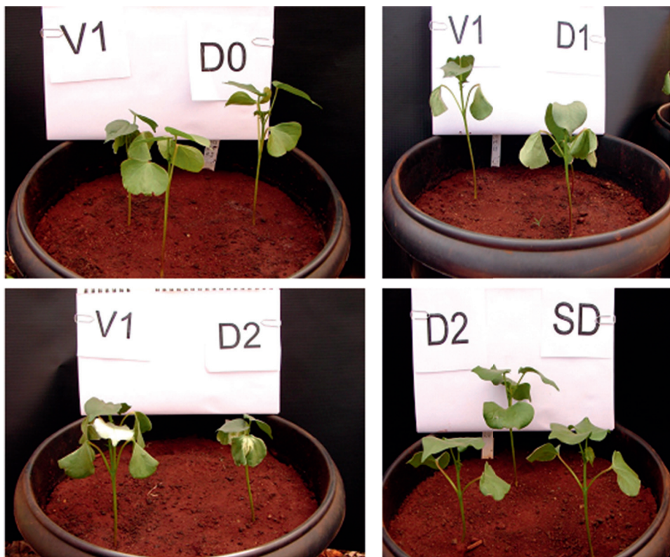
Figura 4. Efeitos do regulador de crescimento aplicado via tratamento de sementes no algodoeiro (cv. BRS 269-Buriti) submetido a estresse hídrico