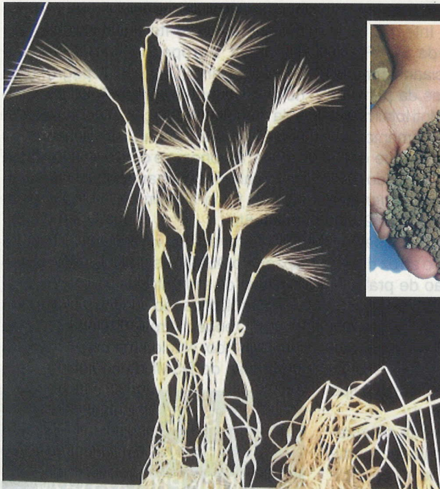
À direita trigo sem aplicação de Silicatos.

A aplicação no solo de silicatos de cálcio ou silicatos de cálcio e magnésio, os quais passam por um tratamento térmico a altas temperaturas, podem trazer inúmeros benefícios para as culturas, como cereais, frutíferas, hor-