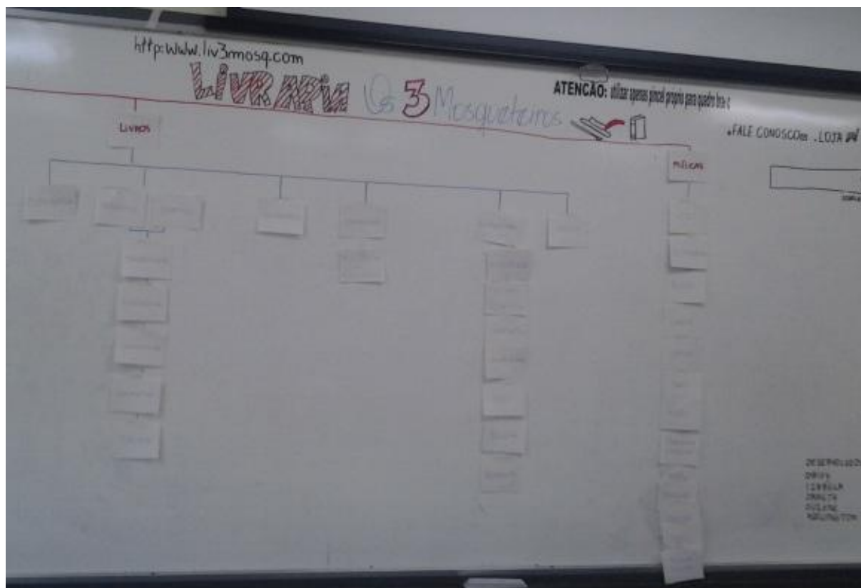
FIGURA 3 - Estrutura da Livraria virtual ‘Os 3 mosqueteiros’