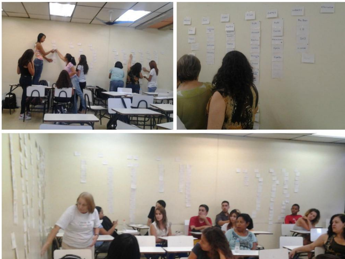
FIGURA 1 - Realização do Card Sorting .