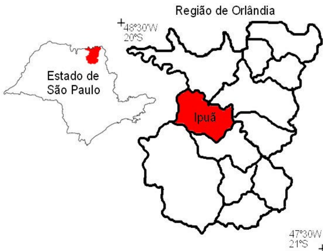
Figura 1 – Representação da localização da região de estudo.

Uma das premissas básicas permitida quase que exclusivamente pelos dados de sensoriamento remoto é que há uma regularidade na distribuição dos pixels numa imagem de satélite. Isso permite que um sistema amostral possa ser definido de tal forma que toda e qualquer unidade de imagem constituída por um pixel possa ter a mesma chance de ser amostrada. Outra característica básica de um sistema amostral baseado nas imagens de satélite é que, embora a unidade amostral seja o pixel, a base para a interpretação e conseqüente atribuição de uma classe a um dado pixel é fundada no talhão a que pertence aquele dado pixel. Para a identificação do talhão, todas as características do sensoriamento remoto que possam auxiliar na interpretação agrícola podem ser utilizadas, como por exemplo, análises multitemporais, conhecimentos prévios, informações de calendário agrícola, processamentos diversos. Para os talhões que eventualmente não puderem ser identificados com segurança, recorre-se a trabalhos de campo.