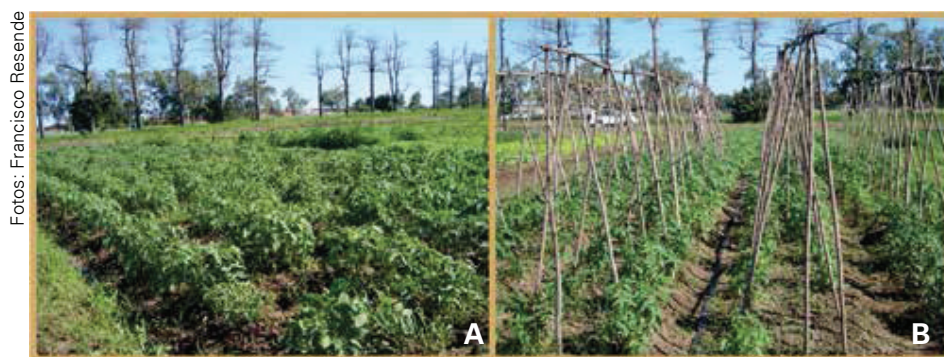
Figura 57. Vista geral dos ensaios de avaliação agronómica de tomate determinado (rasteiro) e indeterminado (tutorado) em duas épocas de cultivo, Primavera/Verão (A) e Outono/Inverno (B).

As Figuras 57 e 58 mostram os ensaios de avaliação agronómica de variedades de tomate em duas épocas de avaliação e o aspecto dos frutos de variedades/híbridos.