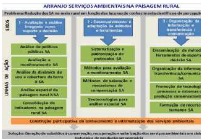
Figura 2. Principais eixos e linhas de pesquisa abordados no Arranjo de Projetos: Serviços Ambientais na Paisagem Rural (Arranjo SA). Elaborada pelos autores.