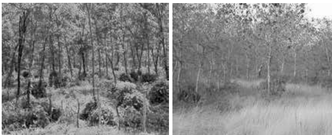
Figura 7 – Manejo dos rebrotes em Irauçuba