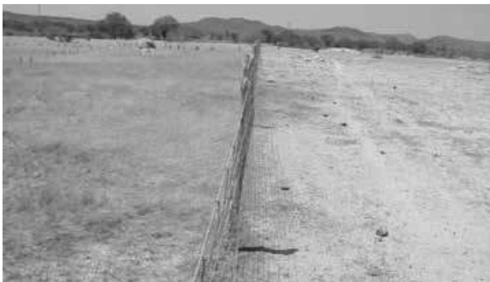
Figura 2 – Contraste de cerca em Irauçuba

estrato herbáceo, embora folhas de espécies lenhosas possam fazer parte significativa de sua dieta. Nesse contexto, o sobrepastejo por ovinos pode resultar no desaparecimento das gramíneas e, ao final, de toda cobertura herbácea da vegetação, expondo o solo aos efeitos da erosão. As mudanças na composição florística da vegetação herbácea podem caracterizar-se ou pela substituição dos capins por ervas de folha larga e/ou arbustos, ou pela invasão da pastagem por gramíneas não forrageiras. Em áreas de caatinga, o pastejo por ovinos induz mudanças significativas na composição botânica do estrato herbáceo, com a redução da participação das gramíneas, mesmo em condições de pastoreio moderado. Vale salientar que o maior índice de preferência por gramíneas é observado no início da estação das chuvas, quando se verifica um uso excessivo da forragem, em virtude da baixa disponibilidade na ocasião. Então as plântulas dos capins são tosadas rente ao solo, impedindo-se, assim, o seu desenvolvimento, causando a falha na produção de sementes e seu consequente desaparecimento do pasto e exposição do solo à erosão (Figura 2). Embora seja considerado baixo o índice de erosão das áreas do planossolo na área do núcleo de Irauçuba, medidas da erosão no planossolo sob sobrepastejo (Figura 2) indicam perdas de solo superiores a 17t/ha em uma única estação das chuvas (Relatório), o que enfatiza a importância da cobertura vegetal na proteção contra a erosão.