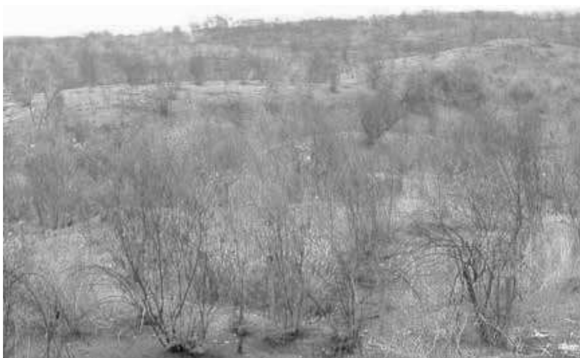
Figura 4 – Disclímax com marmeleiro em Irauçuba

A Figura 3, tomada em setembro de 2005, é bem ilustrativa das etapas iniciais do processo de sucessão secundária, no estágio herbáceo e início do estágio arbustivo. No canto esquerdo inferior estão os restos culturais do roçado de 2005, ano em que a fotografia foi tomada. No canto esquerdo superior está a área desmatada que será queimada e plantada no inverno de 2006. No meio da foto, aparece a área do roçado de 2004, recoberta por vegetação herbácea seca, com pouquíssimas moitas de arbustos. Um pouco mais à direita, em sequência, as áreas dos roçados de 2003 e 2002 caracterizadas por uma crescente cobertura de arbustos.