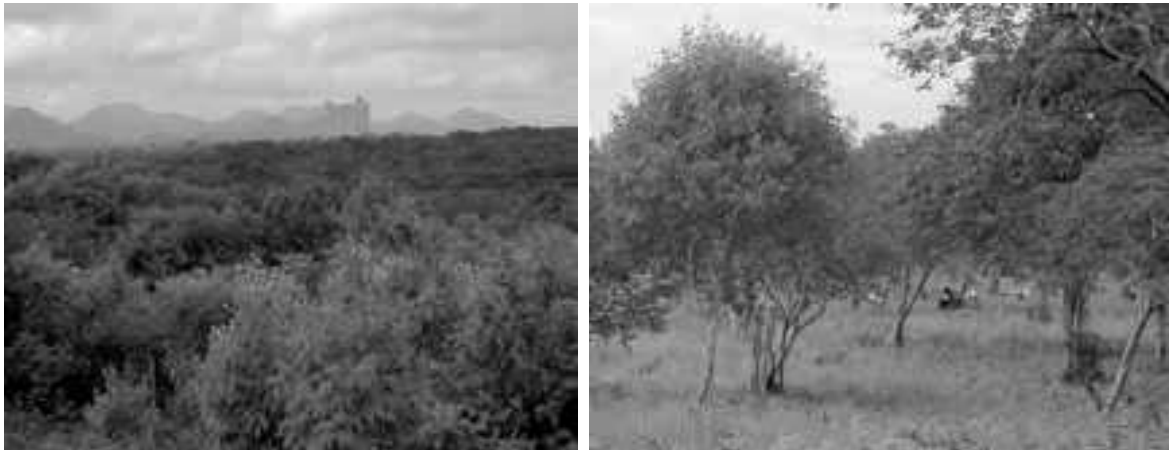
Figura 8 – Caatinga arbustiva-arbórea e caatinga raleada em Irauçuba

Os luvisolos constituem os solos mais utilizados pela agricultura migratória do semiárido nordestino. As práticas rotineiramente adotadas do desmatamento e do fogo, a exposição do solo e a diminuição do período de pousio têm induzido processos de degradação, mormente os de erosão, havendo indicações de que pelo menos 65% da área de cobertura deste importante solo se encontrem em erosão de grave a muito grave.