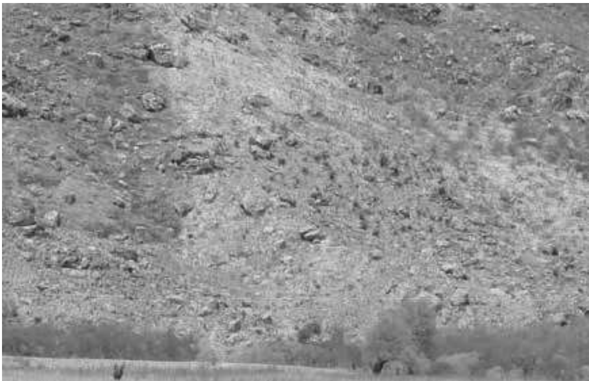
Figura 3 – Agricultura de encosta em Irauçuba

Em Irauçuba, a agricultura do desmatamento e das queimadas é praticada nas áreas recobertas por luvisolos, argissolos e solos litólicos. Como vimos, estes solos estão posicionados sobre um relevo que varia de suave-ondulado a forte-ondulado, ou seja, de declividade de 8 a 45% (Figura 3).