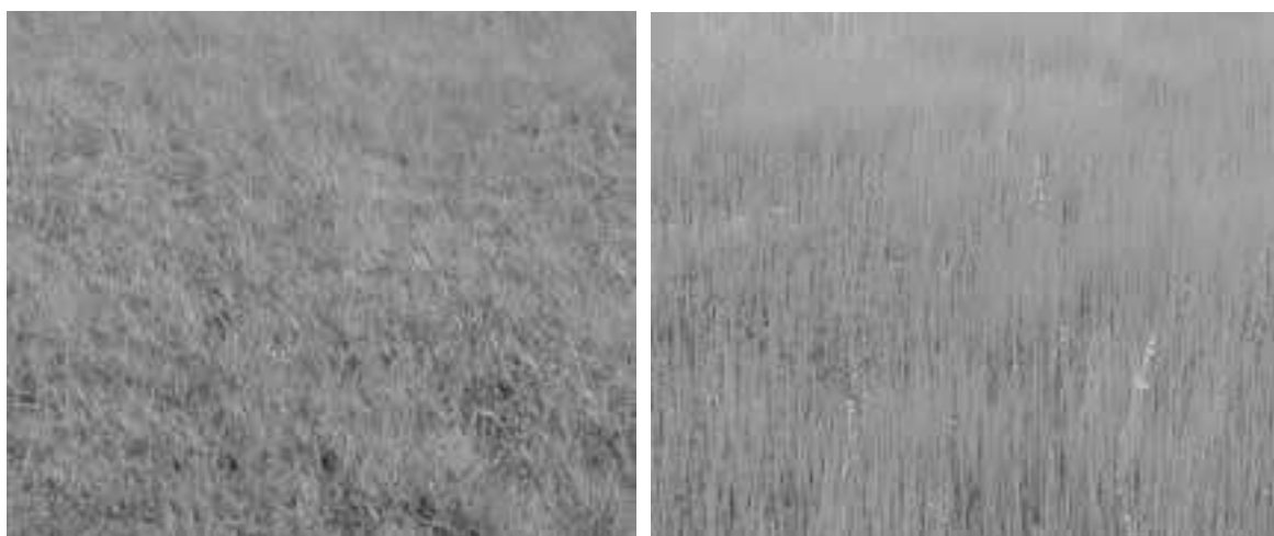
Figura 5 – Área não protegida à esquerda e área em pousio à direita em Irauçuba Fonte: Fotografia obtida por João Ambrósio de Araújo Filho, em 2003.

Em um estudo realizado no período de 2003 a 2006, a produção inicial da área protegida era de 1,09t/ha, equivalente a somente 27,2% do potencial, alcançando, em 2006, 1,7t/ha (Tabela 1). A Figura 5 mostra o efeito do pousio em comparação com a área não protegida. Assim, o pousio durante quatro anos aumentou em 56% a produção de fitomassa do estrato herbáceo.