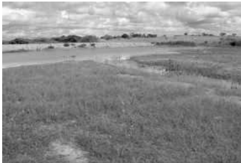
Figura 1– Barreiro da salvação em Irauçuba

No município de Irauçuba, três tipos de solos se destacam: luvisolos, com 43,2% de cobertura; planossolos, com 18,7%; e litólicos, com 33,2%. Juntos eles perfazem 95,1% da área do município. Pode-se afirmar que as atividades de lavoura se concentram nos luvisolos e nos litólicos, enquanto que as de pecuária, nos planossolos e nos luvisolos. Para os planossolos o relevo varia de plano a suave-ondulado (de 1 a 8%), os argissolos e os luvisolos apresentam-se em relevo de suave-ondulado a ondulado (de 8 a 20%) e os litólicos estão em relevo forte-ondulado (de 20 a 45%).