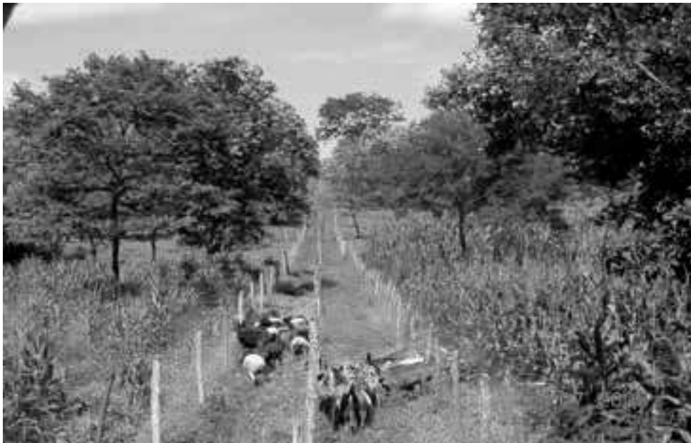
Figura 10 – SAF-Sobral

O modelo SAF-Sobral foi desenvolvido na Embrapa Caprinos e Ovinos, em Sobral, Ceará. Consta de três componentes: a reserva legal, o roçado ecológico e a pastagem (caatinga raleada). Embora o modelo comece a ter impacto sobre a renda familiar a partir de uma área total de 5,0ha, sugere-se 8,0ha como o tamanho mais apropriado. A área de implantação do SAF-Sobral deve ser dividida em três parcelas: