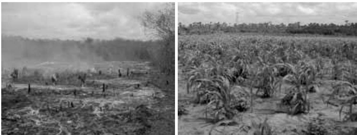
Figura 9 – Queimada e exposição do solo em Irauçuba

Os luvisolos constituem os solos mais utilizados pela agricultura migratória do semiárido nordestino. As práticas rotineiramente adotadas do desmatamento e do fogo, a exposição do solo e a diminuição do período de pousio têm induzido processos de degradação, mormente os de erosão, havendo indicações de que pelo menos 65% da área de cobertura deste importante solo se encontrem em erosão de grave a muito grave.