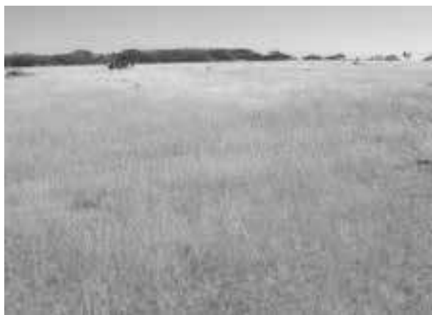
Figura 6 – Área protegida em Irauçuba com dominância do capim panasco

A diferença mais importante entre as duas áreas é que, na primeira, o horizonte A estava reduzido a cerca de 5,0cm, com muitos afloramentos do B textural e, na segunda, o horizonte superficial era de cerca de 20cm.