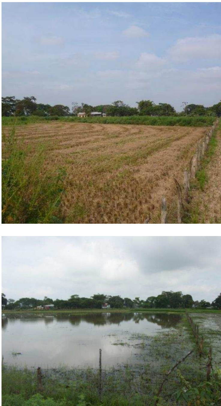
Figura 4. Sequías e inundaciones en Ecuador, caso de estudio, Hacienda: Isla Isabel, provincia del Guayas, en Arriba : noviembre 2013, y Abajo : junio 2014 respectivamente.

El caso de estudio de Brasil se relaciona a las lluvias de gran intensidad de enero de 2011, las cuales golpearon la región montañosa del Estado de Río de Janeiro, donde se consideró específicamente los