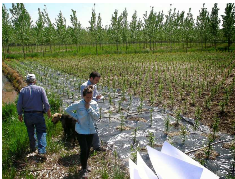
Figura 2. Estación experimental agropecuaria, delta del Paraná.