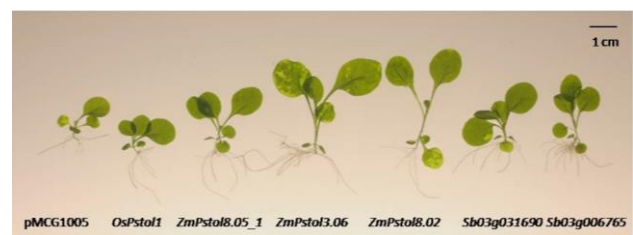
Figura 2 - Plântulas de tabaco individuais crescidas em meio de cultura sob baixo P. Da esquerda para direita: pMCG1005 Ev. 10 (controle), OsPstol1 Ev. 5, homólogos de milho ( ZmPstol8.05_1 Ev. 8, ZmPstol3.06 Ev. 5 e ZmPstol8.02 Ev. 3) e homólogos de sorgo ( Sb03g031690 Ev. 1 e Sb03g006765 Ev. 6).

Na caracterização morfológica do sistema radicular foi observada diferença entre comprimento e área de superfície entre os eventos controles (pMCG1005) e eventos dos genes OsPstol1 , ZmPstol3.06 , ZmPstol8.02 , Sb03g031690 e Sb03g006765 , mas os resultados fenotípicos ainda não são conclusivos, uma vez que as plantas ainda estão no início do desenvolvimento.