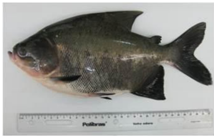
Figura 1: Tambaqui jovem

e fêmeas de tambaqui, indicando a existência de dimorfismo sexual em tambaqui na fase adulta, sendo a fêmea maior e mais pesada, na natureza e em cultivo, após atingir a fase reprodutiva (MELLO et al., 2015; ALMEIDA et al., 2016).