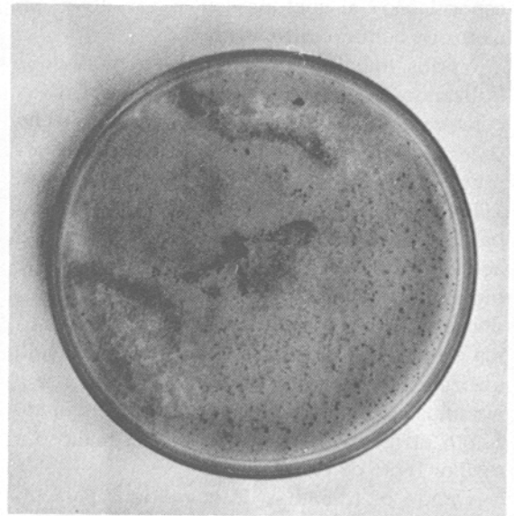
FIG. 3. Colônia de C. gloeosporioides em meio de ASMA-A, mostrando grande número de conídios em acérvulos, produzidos a partir das frutificações desenvolvidas em folhas destacadas.

O grande número de esporos produzidos pelas amostras de C. gloeosporioides nos meios de BDA e ASMA-A após indução em folhas de mamoeiro leva a crer que o processo reprodutivo se encontrava bloqueado pelo fato de essas culturas terem sido preservadas em óleo mineral, possivelmente sem apresentarem