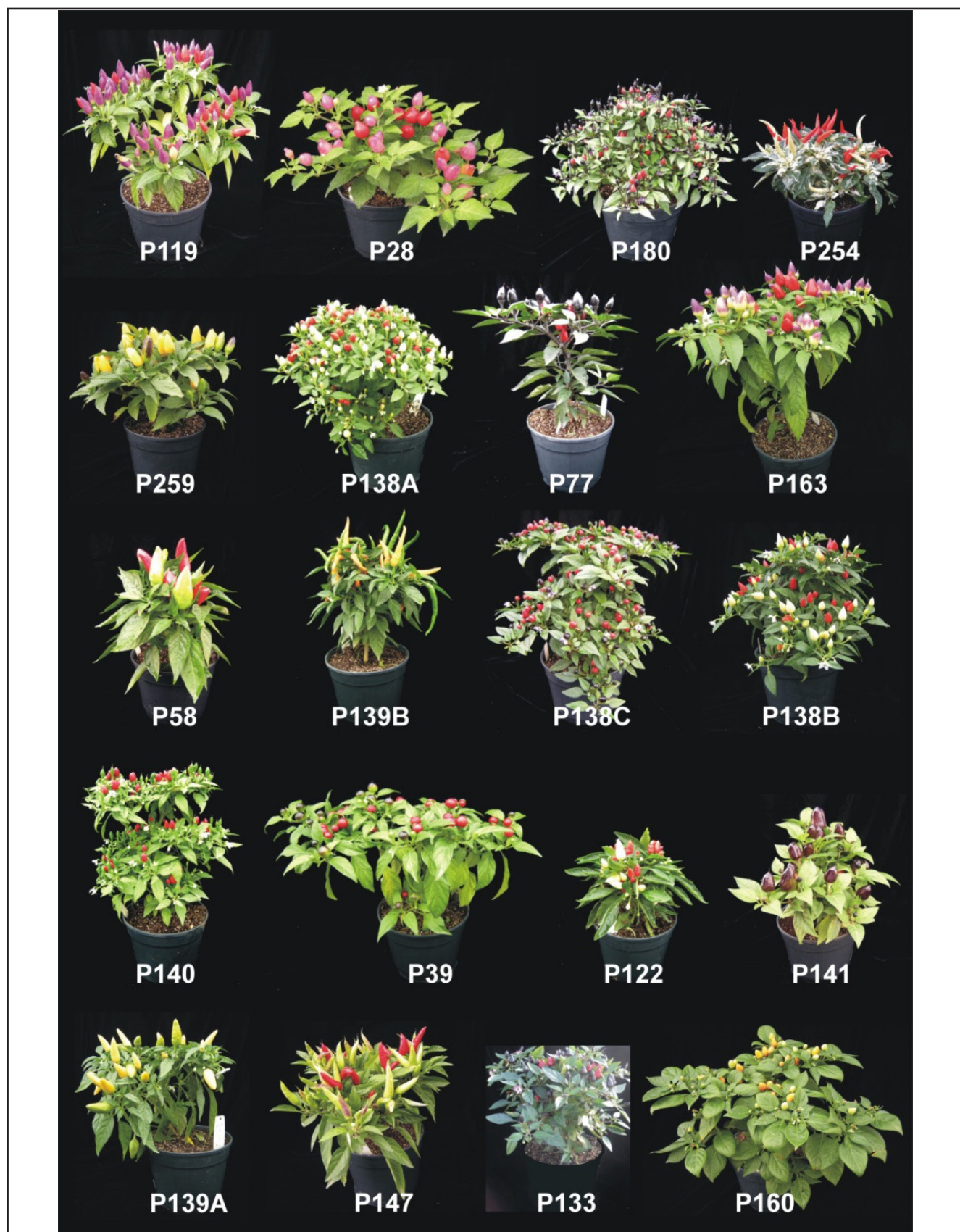
Figura 2. Acessos de pimentas ornamentais do Banco Ativo de Germoplasma de Capsicum da Embrapa Clima Temperado usadas no estudo da percepção do consumidor. As plantas estão ordenadas de acordo com o valor ornamental recebido, em ordem decrescente, da esquerda para a direita e de cima para baixo (accessions of ornamental peppers from Capsicum Active Germplasm Bank of Embrapa Temperate Agriculture used in the study of consumer's perception. The plants are ranked according to their ornamental value in descending order from left to right and top to bottom). Pelotas, Embrapa Clima Temperado, 2012.