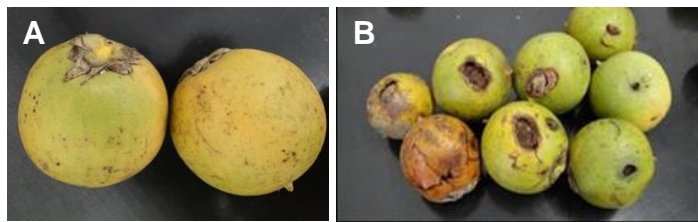
Figura 1 - Frutos maduros de Astrocaryum aculeatum . A) aspecto dos frutos utilizados nos estudos morfológicos; B) frutos apresentando danos no epicarpo.

Foram coletados, ao acaso, 300 frutos completamente maduros, em 15 plantas. No laboratório foram selecionados frutos íntegros e descartados aqueles que estavam em estágio muito avançado de maturação ou com danos no endocarpo (Figura 1 A e B).