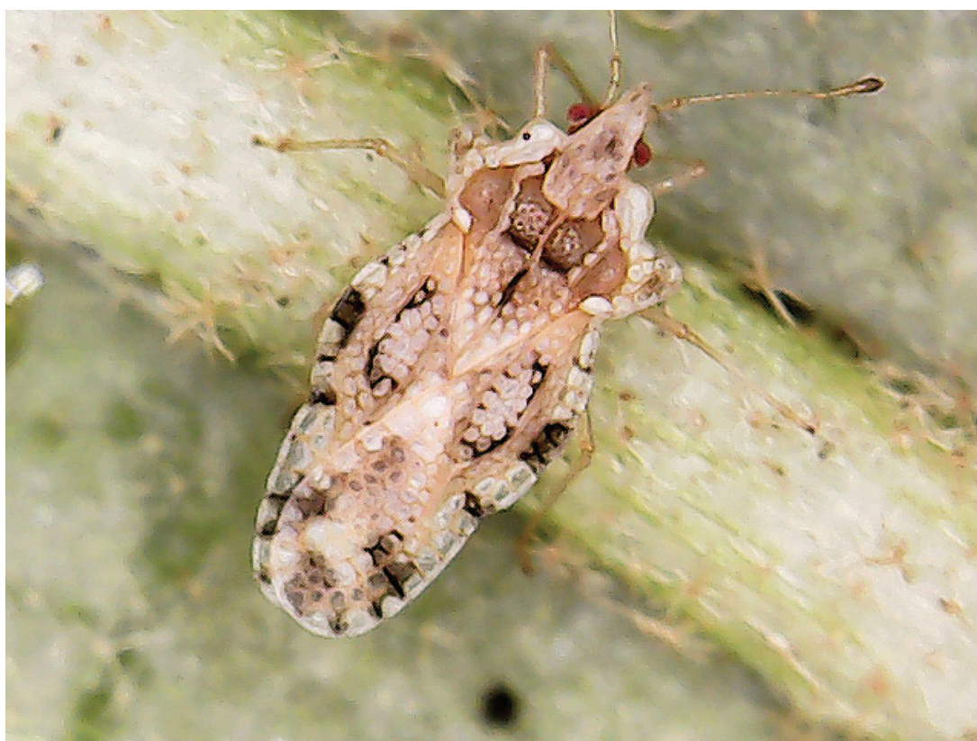
Figura 1. Corythaica passiflorae (Berg) (Hemiptera: Tingidae) em folha de jiló, em cultivo comercial no Município de Paraíso do Tocantins, TO.

A fertilidade do solo possui influência direta no desenvolvimento de plantas e pode afetar indiretamente a densidade populacional de insetos fitófagos (HERZOG & FUNDERBURK 1986; SCHULZE & DJUNIADI 1998). A quantidade de nitrogênio e potássio fornecida às plantas de S. melongena podem influenciar na resistência ou susceptibilidade ao ataque de C. passiflorae . A berinjela é considerada a cultura mais suscetível à C. passiflorae que outras plantas da família das solanáceas (KOGAN 1960; VENTURA et al. 2007).