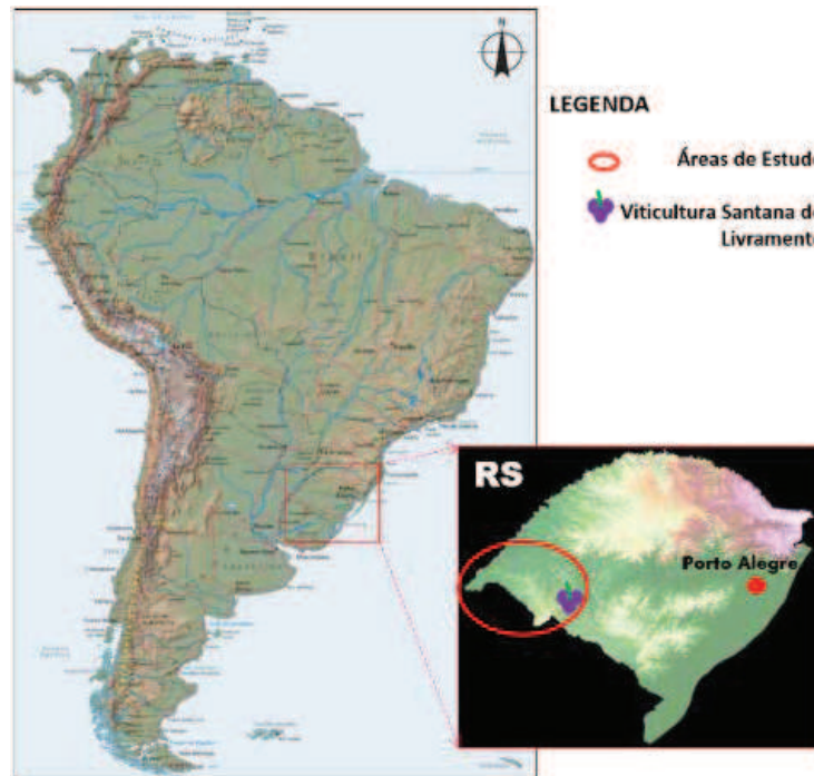
Figura 1 – Localização da área estudada, Campanha Oeste do RS, Brasil.

cimento e análise de relevo a partir de dados georreferenciados sobre altimetria, declividade e exposição solar (HOFF et al., 2015).