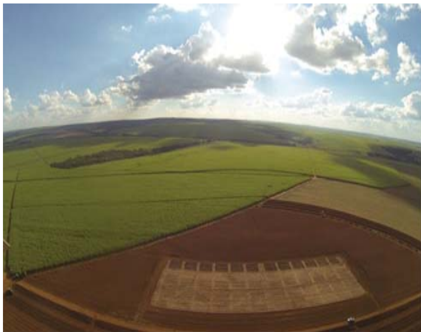
Figura 1. Vista área experimental na fase de implantação.