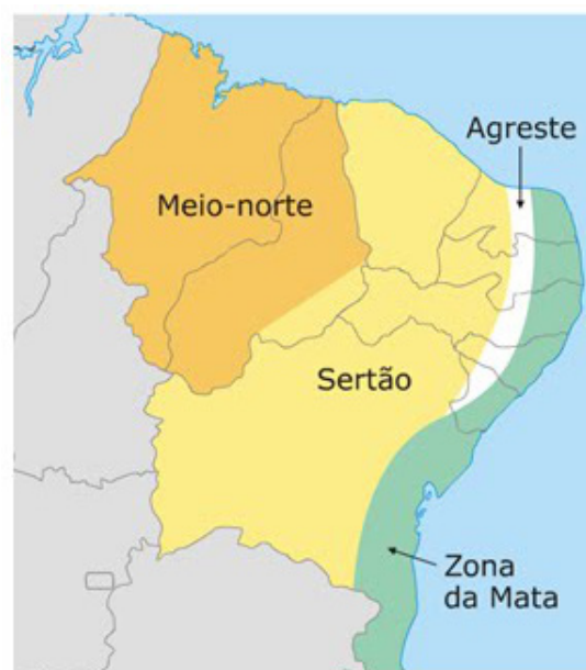
Figura 1. Sub-regiões do Nordeste Brasileiros

A região Nordeste do Brasil compreende 1,56 milhão de km 2 , dos quais o Semiárido ocupa 0,98 milhão, sendo 0,58 milhão restante ocupado pelo Meio Norte, MaToPiBa (áreas do Maranhão, Piauí, Tocantins e Bahia com características de Cerrado) (Figuras 1 e 2) e pela Zona da Mata e áreas costeiras.