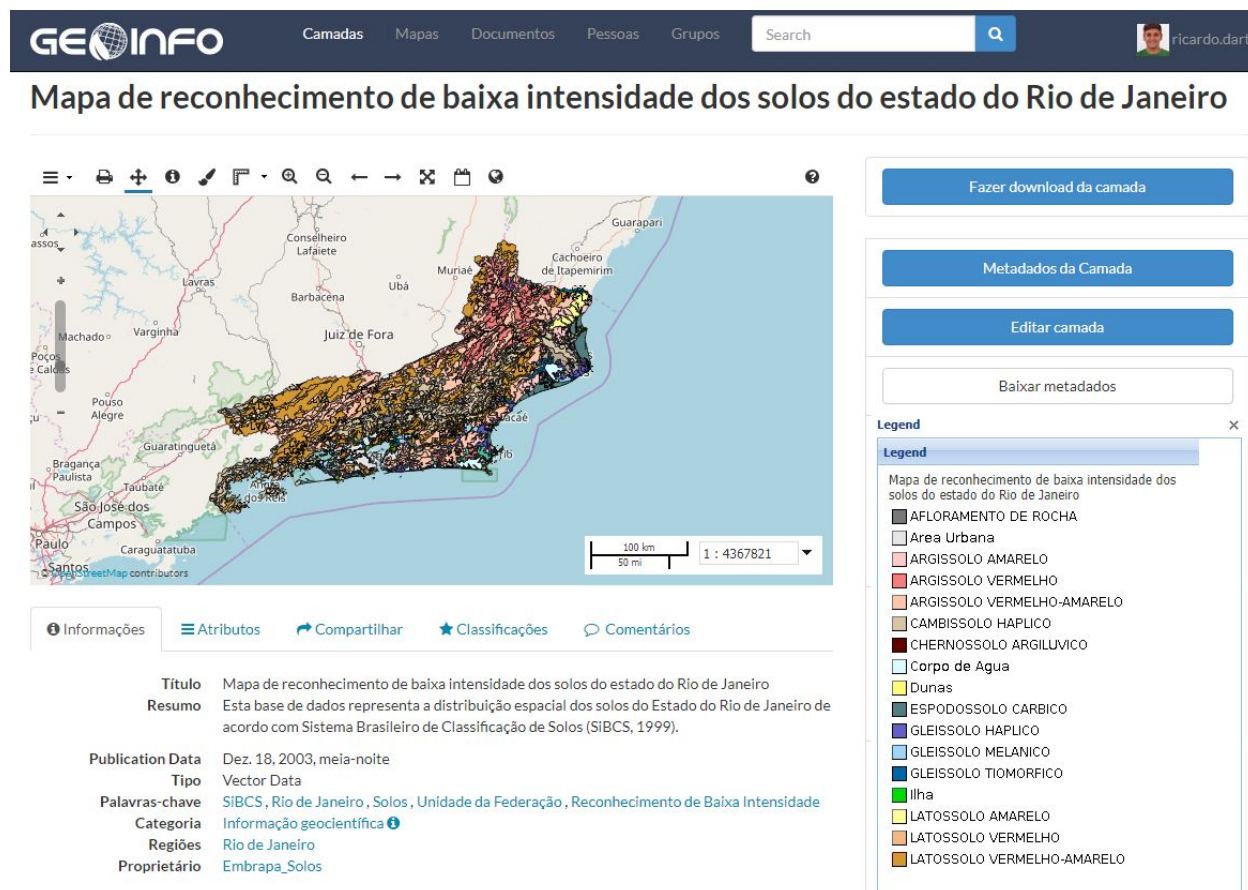
Figura 3 Mapa de solos do estado do Rio de Janeiro, em escala 1:250.000, e visualização simplificada dos respectivos metadados.

Os metadados completos podem ser visualizados pela interface web ao acionar o botão “Metadados da Camada”, bem como podem ser consumidos por serviço web ou por download do arquivo XML (eXtensible Markup Language), nos formatos ISO, FGDC, eBRIM, Dublin Core, DIF ou Atom.