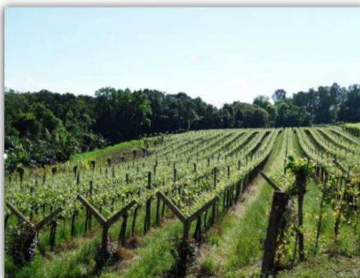
Figura 5. Sistema de condução espaldeira e Y, MR Caxias do Sul, Serra Gaúcha.

A beleza natural da MR Caxias do Sul, com seus vales, rios, vegetação nativa e rochas, tem encantado os turistas. A Figura 6 é uma amostra da natureza exuberante.