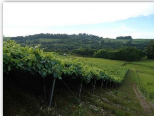
Figura 4. Sistema de condução latada, MR Caxias do Sul, Serra Gaúcha.