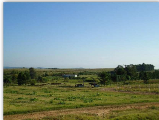
Figura 11. Áreas de pecuária e culturas anuais localizadas nas MRs da Campanha.