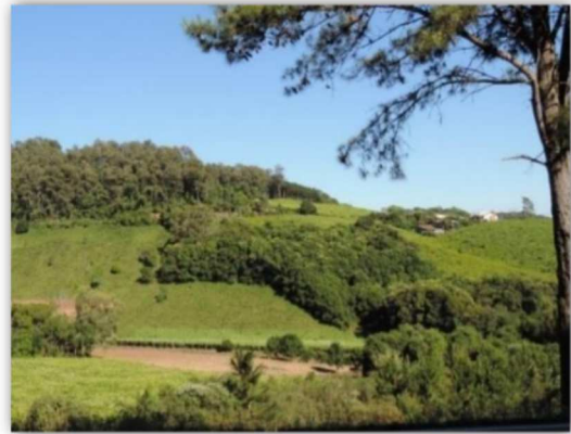
Figura 2. Áreas acidentadas e de preservação na MR Caxias dos Sul, Serra Gaúcha

Os diferentes estádios de desenvolvimento da videira podem ser observados na Figura 3, com a videira ainda em repouso, a presença dos produtores realizando a poda da videira, o início da brotação e formação dos cachos, que aparecem por ocasião da floração e um vinhedo de alta produtividade, com uvas ainda verdes.