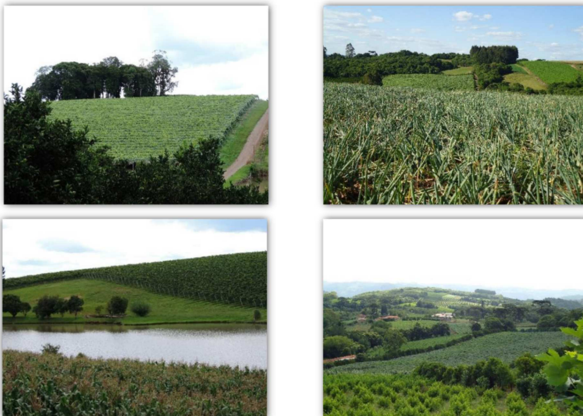
Figura 1. Diversidade de cultivo na MR Caxias do Sul, Serra Gaúcha.

Nessa região há diversidade de cultivos a exemplo de laranjeiras, pessegueiros, plantações de milho e de cebola (Figura 1).