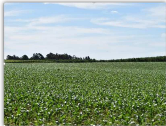
Figura 9 Pomares e culturas anuais localizadas na MR Caxias do Sul, Serra Gaúcha.