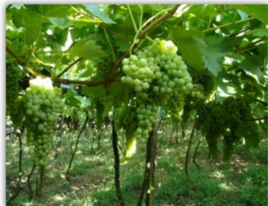
Figura 3 – Diferentes estádios de desenvolvimento dos vinhedos na MRH Caxias do Sul, Serra gaúcha.