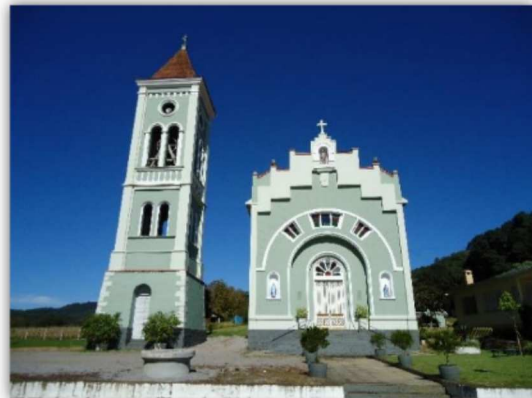
Figura 8. Capitéis e Capelas localizadas na MR Caxias do Sul, Serra Gaúcha.

Na MR Vacaria o cultivo de vinhedos com variedades de uvas Vitis vinifera L, é realizado em ambiente com a presença de pomares e culturas anuais extensivas, conforme mostra a Figura 9.