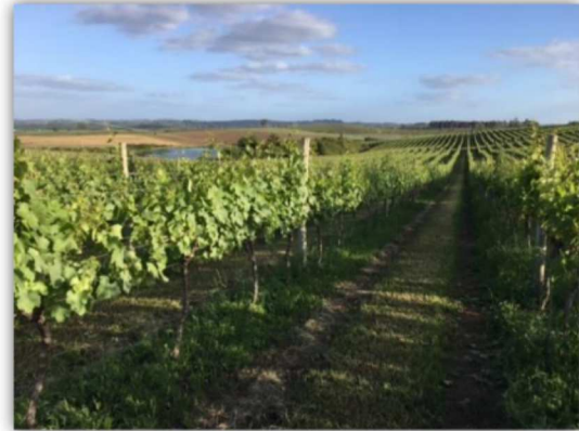
Figura 10 Vinhedos localizados nas MRs da Campanha e Serras de Sudeste.