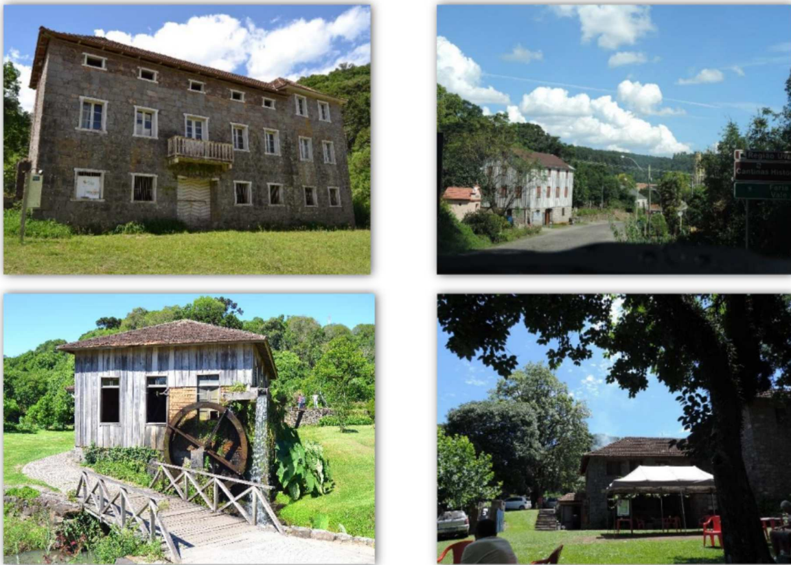
Figura 7. Casarões localizados na MR Caxias do Sul, Serra Gaúcha.

A cultura religiosa representada com a presença de capitéis e capelas, está presente em todo a zona rural da MR Caxias do Sul, composta por 19 municípios (Figura 8).