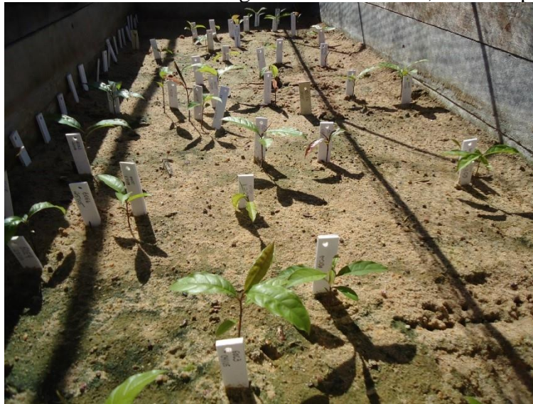
Figura 1. Plântulas de B. excelsa germinadas em areia, cobertas por sombrite 50%

O número total de sementes plantadas foi de 1348 (TABELA 1). A primeira avaliação do experimento foi 53 dias após a semeadura, dia em que a primeira progênie germinou, estendendo-se por um prazo de dezoito meses, e após esse período não ocorreram novas germinações. Foi identificada a data da germinação de cada semente e o número de dias para germinar (NDG) e, semanalmente, as progênies eram avaliadas medindo-se o diâmetro do coleto (DC), com auxílio de um paquímetro digital, e sua altura total (AT), com uma régua, considerando a superfície do substrato até a gema apical. As progênies foram medidas por quatro semanas consecutivas após a germinação, antes de serem transplantadas para sacos plásticos (20x34 cm) contendo substrato comercial, composto por turfa, casca de pinus e vermiculita.