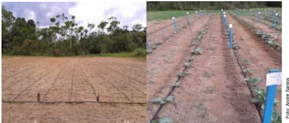
Figura 6. Sistema de irrigação por gotejamento utilizado nos experimentos.

As adubações em cobertura com sulfato de amônio e cloreto de potássio nas doses de 200 \text{ kg ha}^{-1} \text{ N} e 60 \text{ kg ha}^{-1} \text{ K}_2\text{O} , respectivamente, foram parceladas em quatro vezes com intervalo de quinze dias entre elas, sendo a primeira realizada aos 20 dias após o transplante das mudas, conforme recomendação de Trani et al. (1997) para a cultura do brócolis.