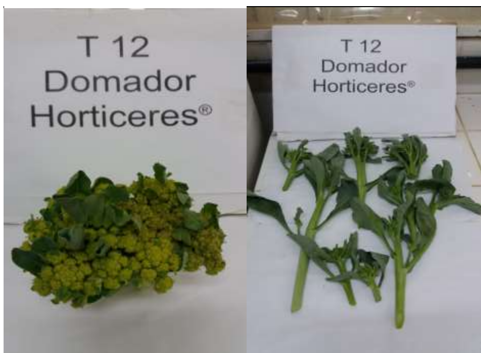
Figura 12. Cultivar Domador com inflorescências dos grupos “cabeça” única e ramoso.

A cultivar Domador, que segundo informações da empresa responsável por sua comercialização, deve formar inflorescência característica de cultivar do grupo “cabeça” única, apresentou desenvolvimento vegetativo idêntico às demais cultivares e emitiu inflorescências ora característica do grupo “cabeça” única, ora característica do grupo ramoso (Figura 12).