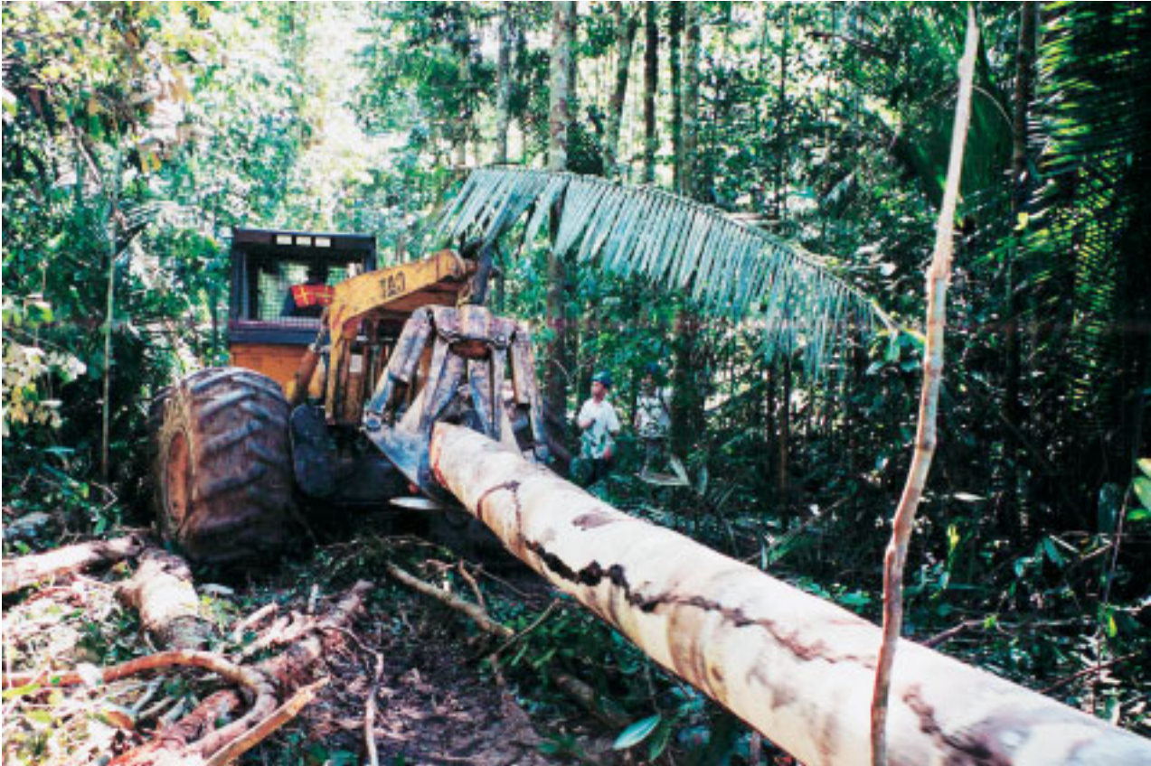
Exploração de impacto reduzido: Floresta Amazônica

florestais. Apesar do uso econômico de inúmeros produtos da floresta por muitos séculos, a discussão atual ainda é sobre como viabilizar a sustentabilidade desses produtos, além da madeira. O extrativismo vigente deve mudar de patamar, passando para o manejo florestal, almejando a sustentabilidade. Há no mundo demanda crescente para que as florestas sejam manejadas mantendo todos os seus recursos. Esse paradigma tem induzido ao desenvolvimento de critérios e indicadores do que seja o manejo sustentável da floresta.