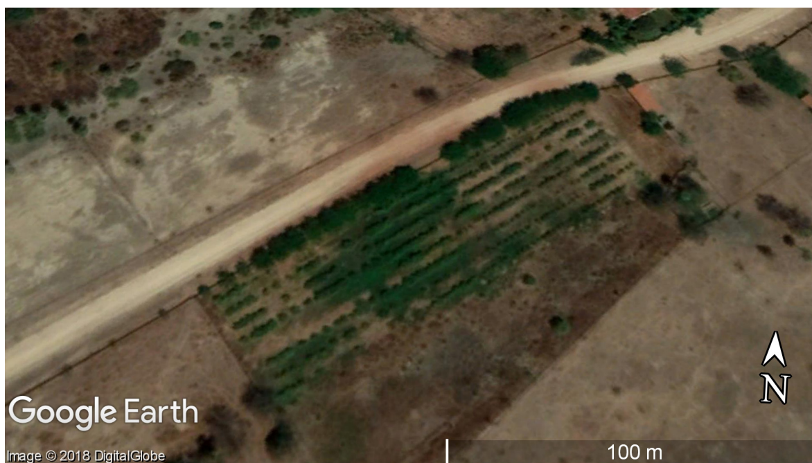
Figura 1. Área Experimental Nilson Mendonça, Sítio Pau Branco, Russas – CE, Brasil. Data da imagem: 29/12/2016.

O desenvolvimento vegetativo das combinações foi obtido a partir de avaliações biométricas realizadas aos 18, 24, 30 e 36 meses após o transplântio, nas quais mediam-se: a altura (h), do colo ao ápice; e os diâmetros da copa, nos sentidos entre plantas e entre linhas (Dl e Dr), utilizando trena milimetrada; e os diâmetros do enxerto e do porta-enxerto, tomados 10 cm abaixo e acima do ponto de enxertia das combinações, utilizando paquímetro digital