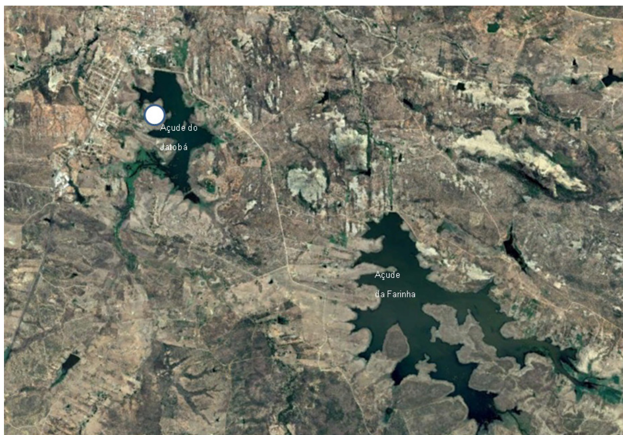
Fig.1. Localização do Núcleo de Pesquisa para o Trópico Semiárido, Universidade Federal de Campina Grande (marcado no círculo branco), às margens do Açude do Jatobá, município de Patos, PB.

O estudo foi realizado de abril 2011 a setembro 2014 no Núcleo de Pesquisa para o Trópico Semiárido ("Fazenda Nupeárido"), da Universidade Federal de Campina Grande (07°0'25"S, 37°16'41"O), município de Patos, PB. Localizada a uma altitude de 242m, a fazenda situa-se às margens do Açude do Jatobá e aproximadamente a 2,9 km do Açude da Farinha (Fig.1), grandes reservatórios que abastecem a região, com capacidade para 17 e 27 milhões de metros cúbicos de água, respectivamente.