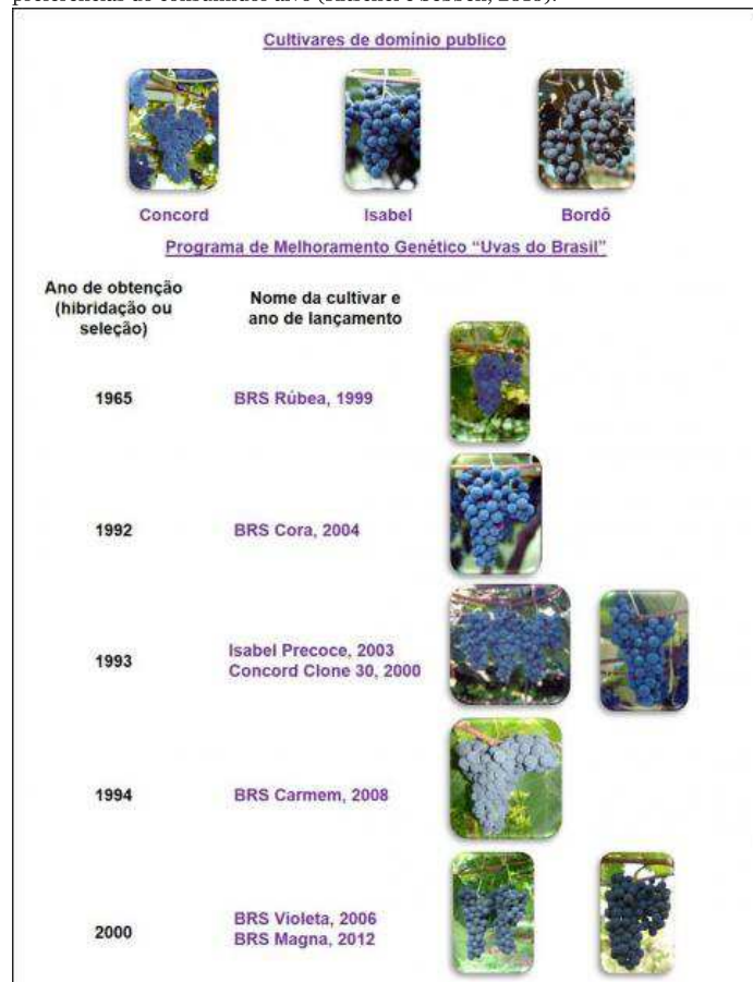
Figura 2. Matriz brasileira de cultivares de uvas para elaboração de suco (Embrapa, 2018b).