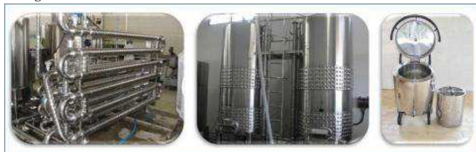
Figura 4. Equipamentos usados para elaboração de sucos de uva, por meio de aquecimento: Foto 1 - Tubulação de extração e elaboração de sucos, com uvas circulando na tubulação e posterior separação por esgotadores; Foto 2 - Cuba vertical de extração e elaboração de sucos, com uvas estáticas e bombeamento externo do suco durante a extração; e, Foto 3 - Suquificador, novo equipamento para elaboração de suco de uva integral em pequenos volumes.