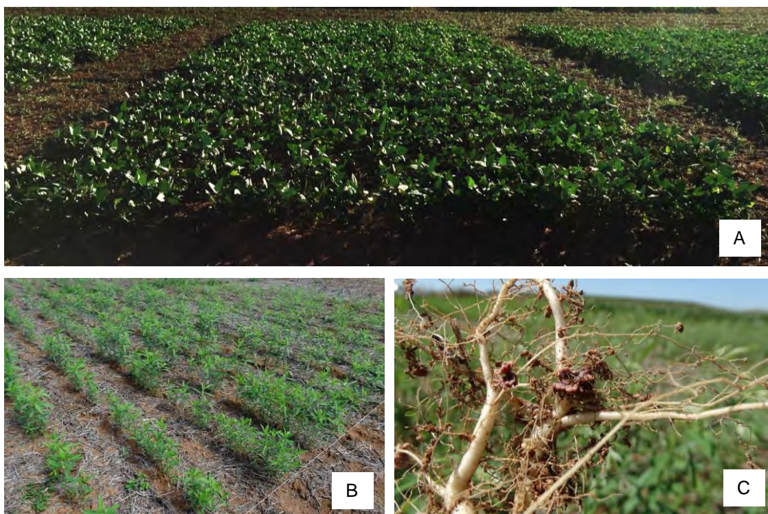
Figura 2. A: Experimento de fixação biológica com feijão caupi na cidade de Nova Ubiratã, MT (A); experimento de fixação biológica com Crotalaria juncea na fazenda experimental da Embrapa Agrossilvipastoril (B); detalhe da raiz de com Crotalaria juncea com nódulos (C).