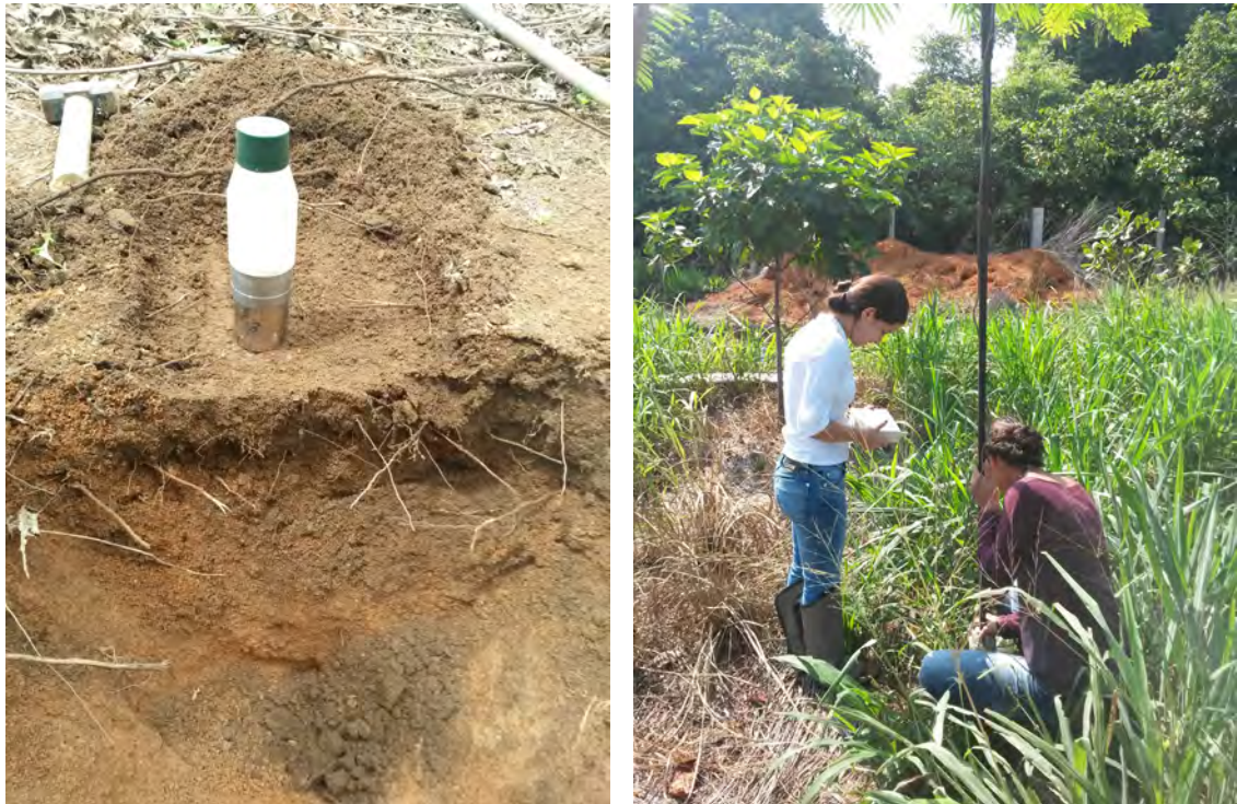
Figura 1. Detalhe da retirada de amostra indeformada de solo para calibração da sonda e monitoramento periódico em um modelo de recomposição de Reserva Legal.

Figura 1 pode-se visualizar as etapas de amostragem de solo para determinação da densidade do solo, umidade volumétrica e calibração da sonda, bem como o monitoramento da umidade do solo.